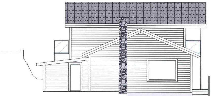
Fasade mot sør

- - - - - Terreng før endring - - - - - Terreng etter endring