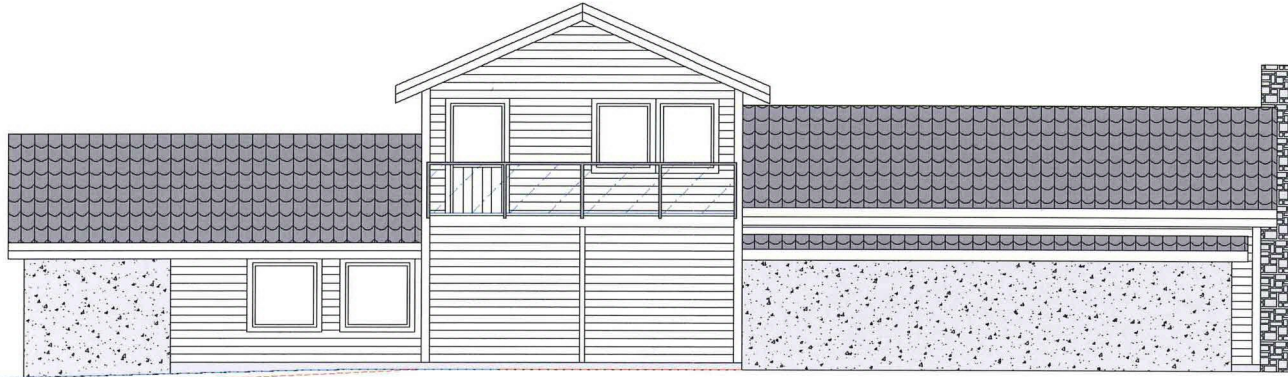
Fasade mot vest