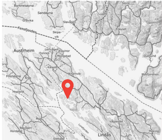
Oversiktskart som syner planområdets plassering på Risøy