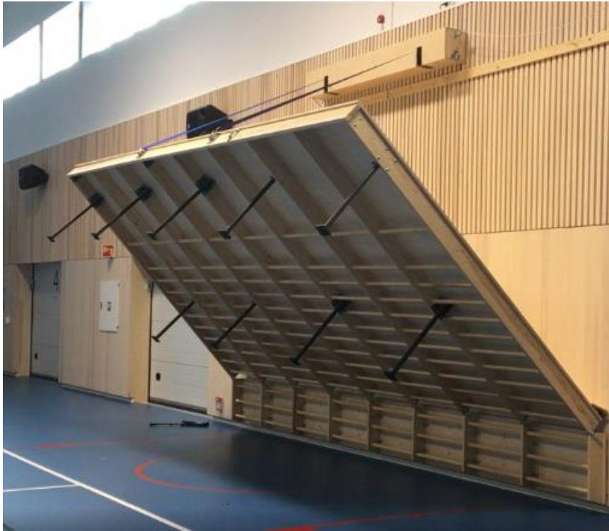
Bilde 4: Viser eksempel på motorisert hev/senk ribbevegg.