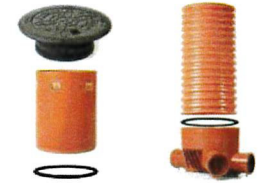
Eksempel spillvannskum Plast