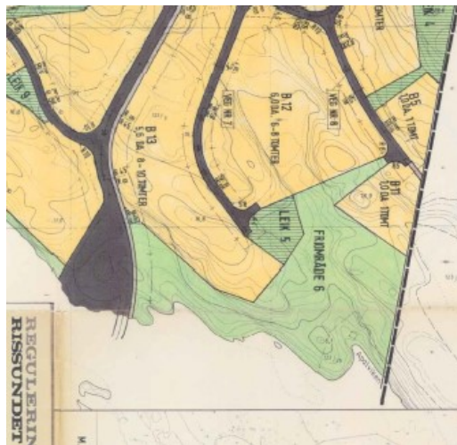
Skisse av tiltaket