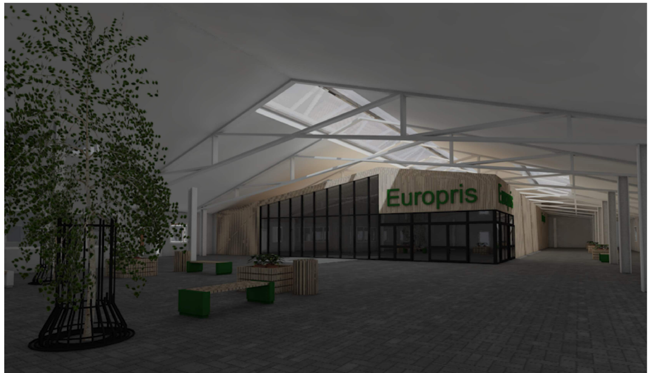
Illustrasjon innvendig Torg