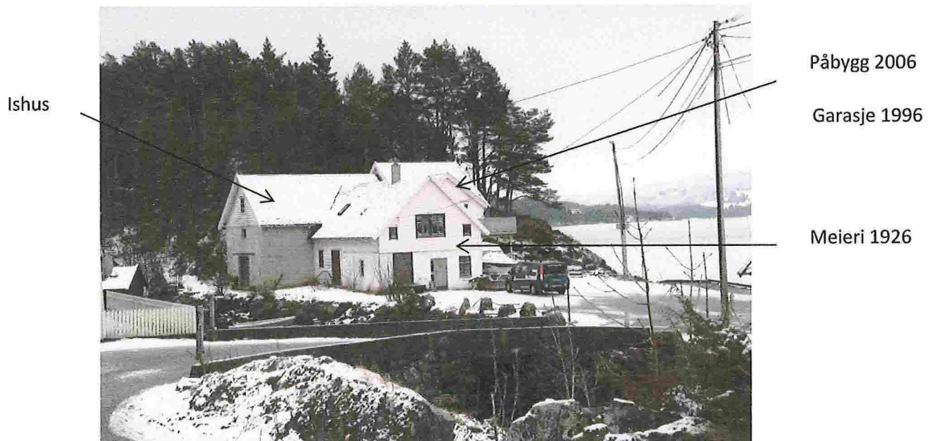
Hundvin kai sett fra nord, mars 2011

Nytt tilbygg fra 2006 over garasjen, ligger ca. 1 meter under loftsetasjen i ishuset.