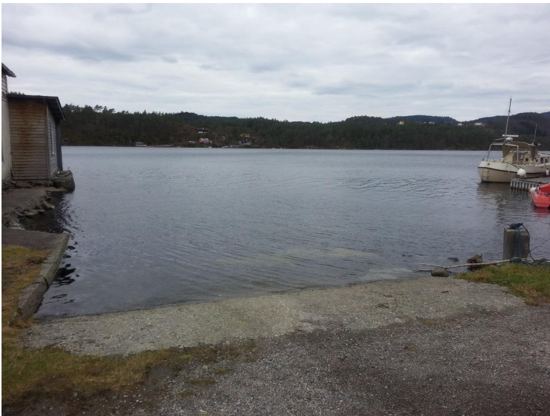
Figur 19 - Bnr. 31.