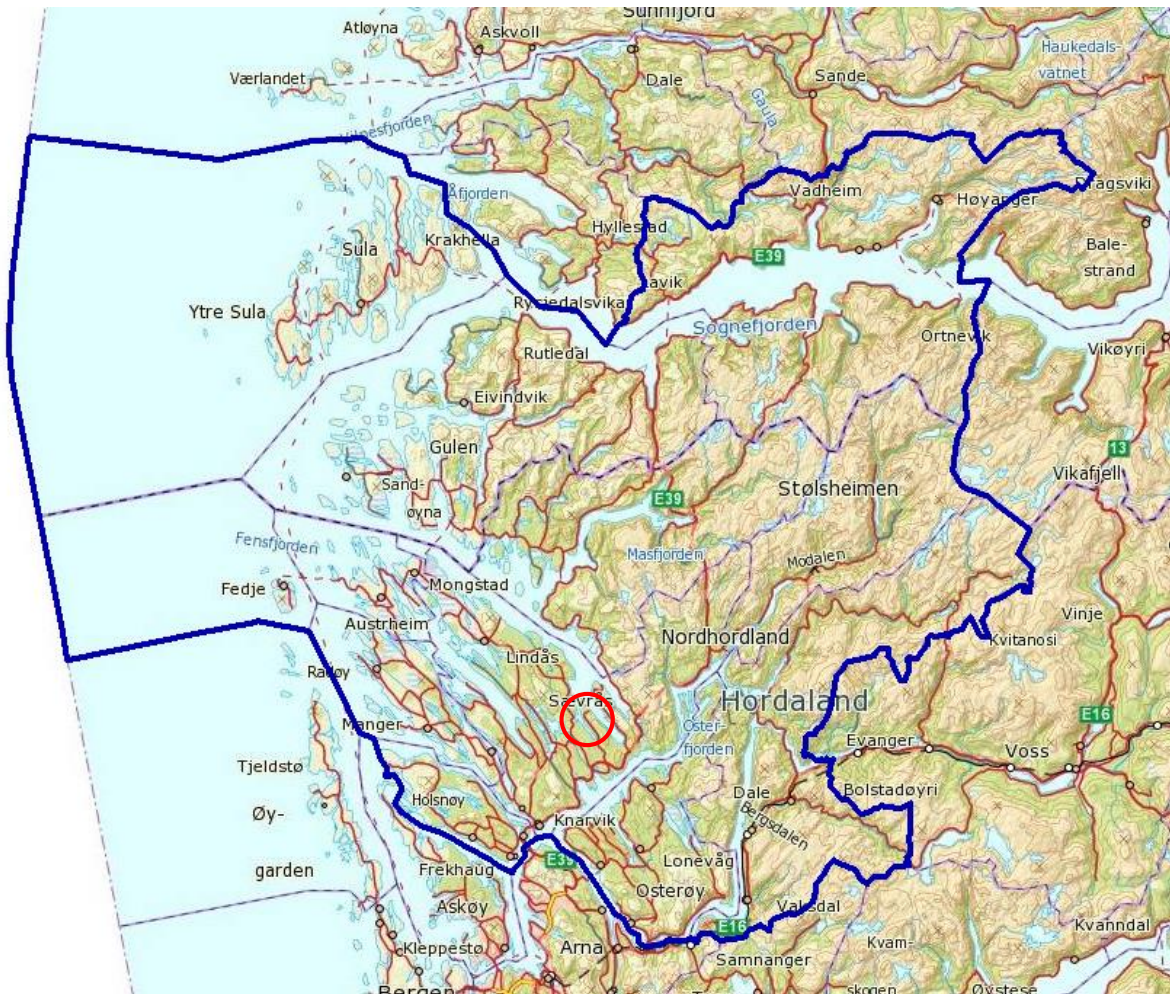
Figur 2 - Oversikt

Området er i kommuneplanen avsett til småbåthamn og bustad, og det er markert ein byggjegrænse mot sjø. Føresegn i kommuneplanen, seier at ein ved utarbeiding av reguleringsplan for S8 skal gjera ei særskild vurdering av vindtilhøva, jf. ROS-analysen. Det skal planleggjast slik at bygg og anlegg ikkje tek unødig skade av sterk vind.