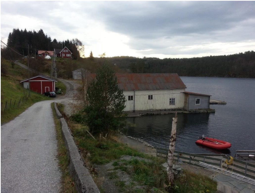
Figur 6 - Tilkomstveg ned til området. Nr. 29 til høgre i bildet, og garasjen i bakkant av nr. 29.