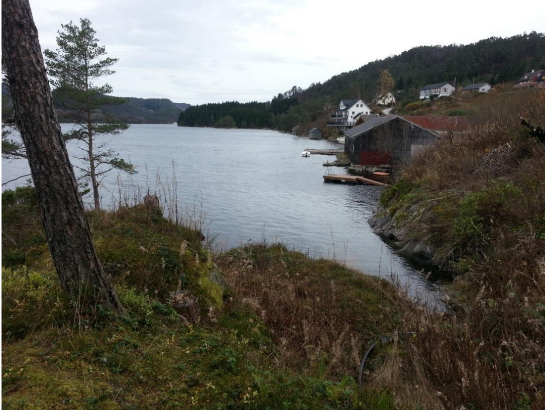
Figur 16 - Framtidig badeplass i vik, sett mot nord. Resten av planområdet i bakgrunnen.