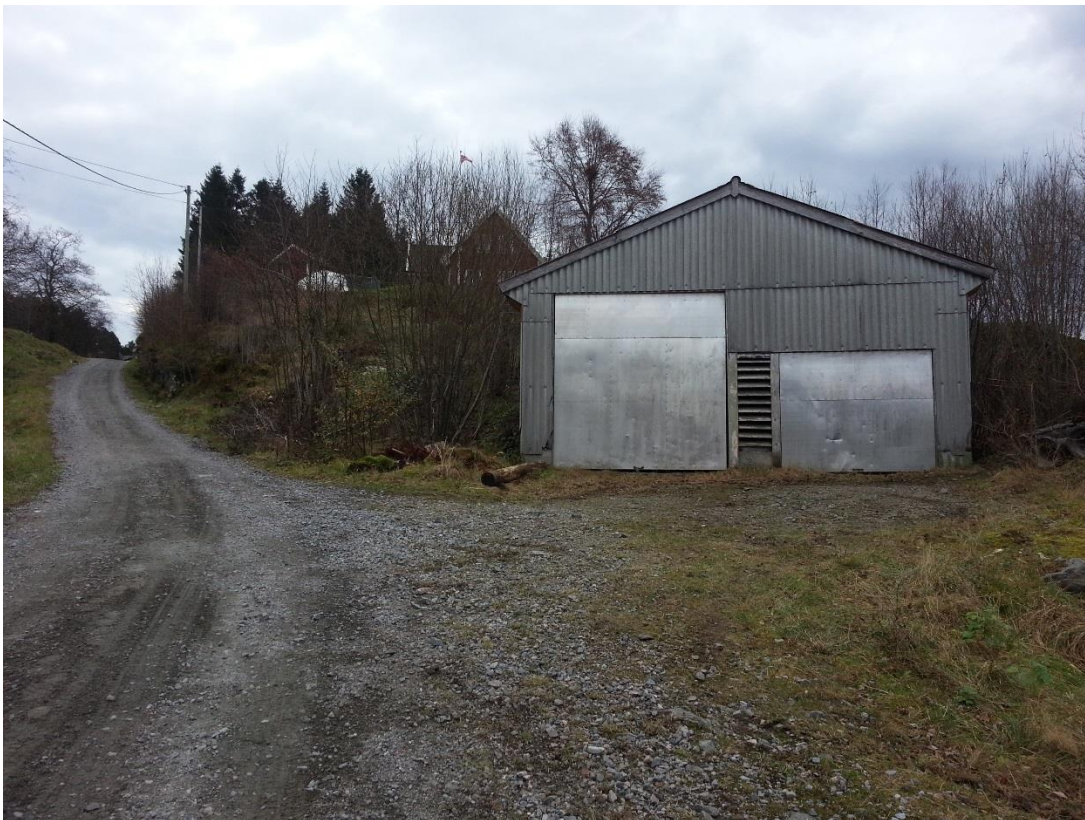
Figur 15 - Garasje som ein vil fjerna. Ein vil byggja ein to einebustader eller ein tomannsbustad på arealet.