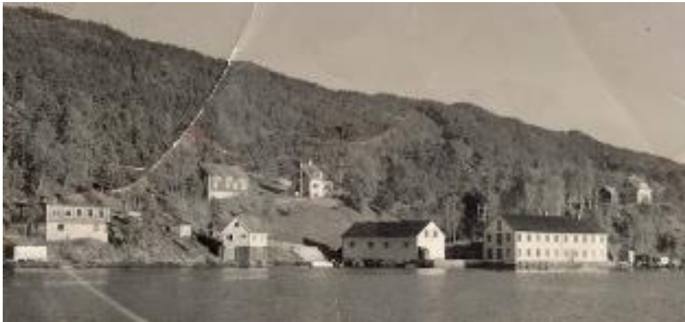
Figur 1 - Åsgard med møbelfabrikk på 1940-tallet.