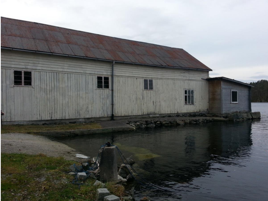
Figur 10 - Nr. 29, sett mot sørvest.