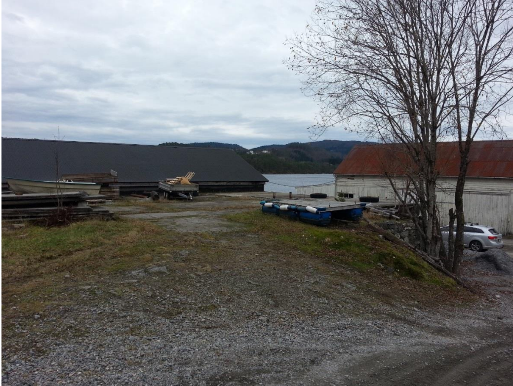
Figur 8 - Dei to lagerbygga. Nr. 31 til venstre, og nr. 29 til høgre.