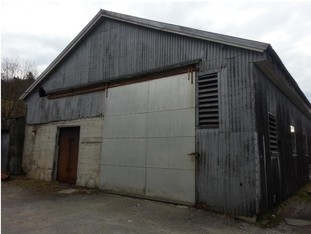
Figur 11 - Nr. 31, sett mot søraust.