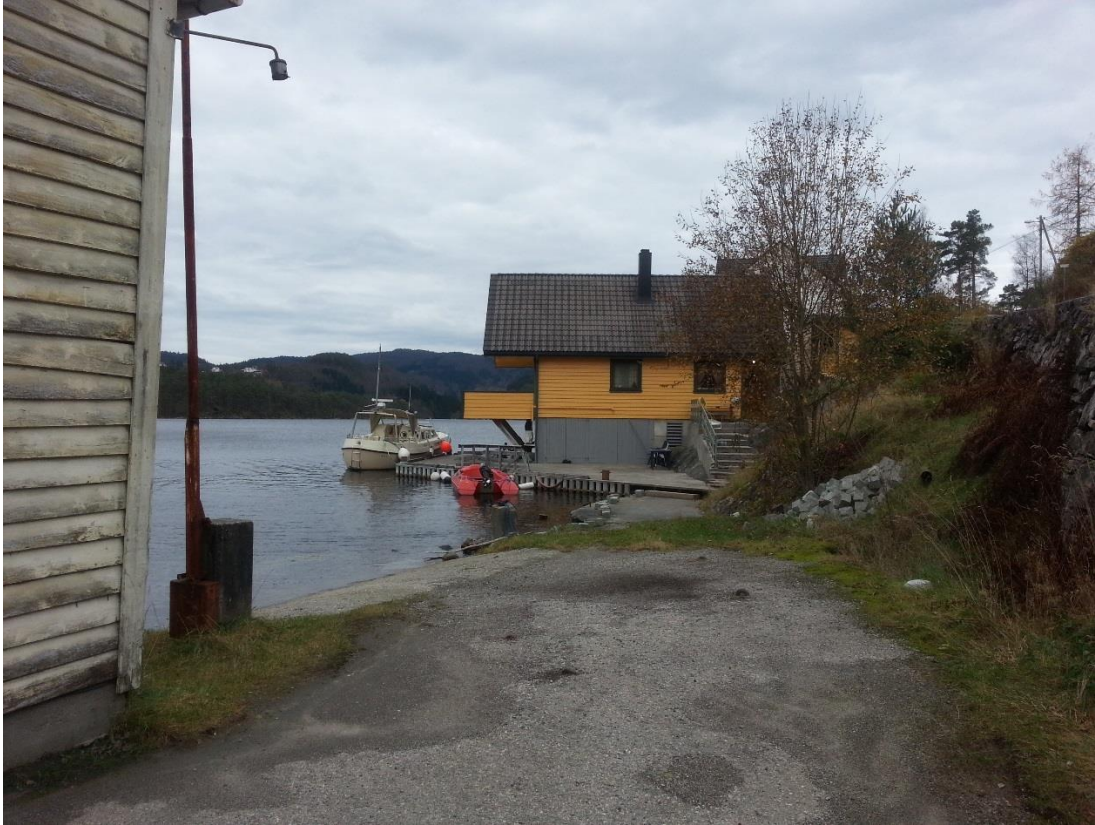
Figur 18 - Bnr. 31 ligg mellom den gule bustaden (nr. 27) og lagerbygningen i nord (nr. 29).