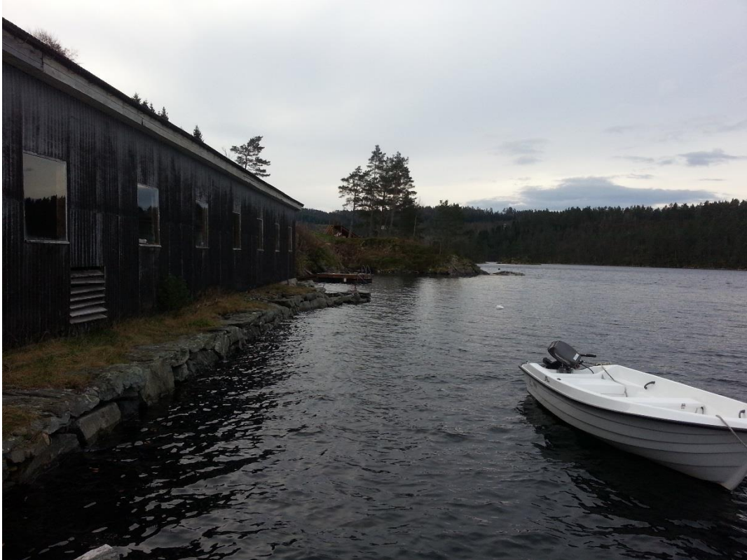
Figur 12 - Nr. 31, sett mot søraust. Framtidig friområde med badeplass i bakgrunnen.