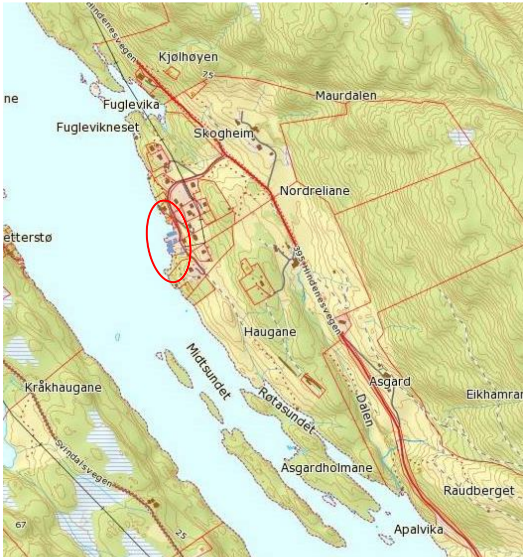
Figur 3 - Oversikt