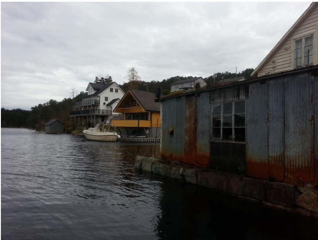
Figur 17 - Bnr. 29 ligg i front av den kvite bustaden (nr. 19).