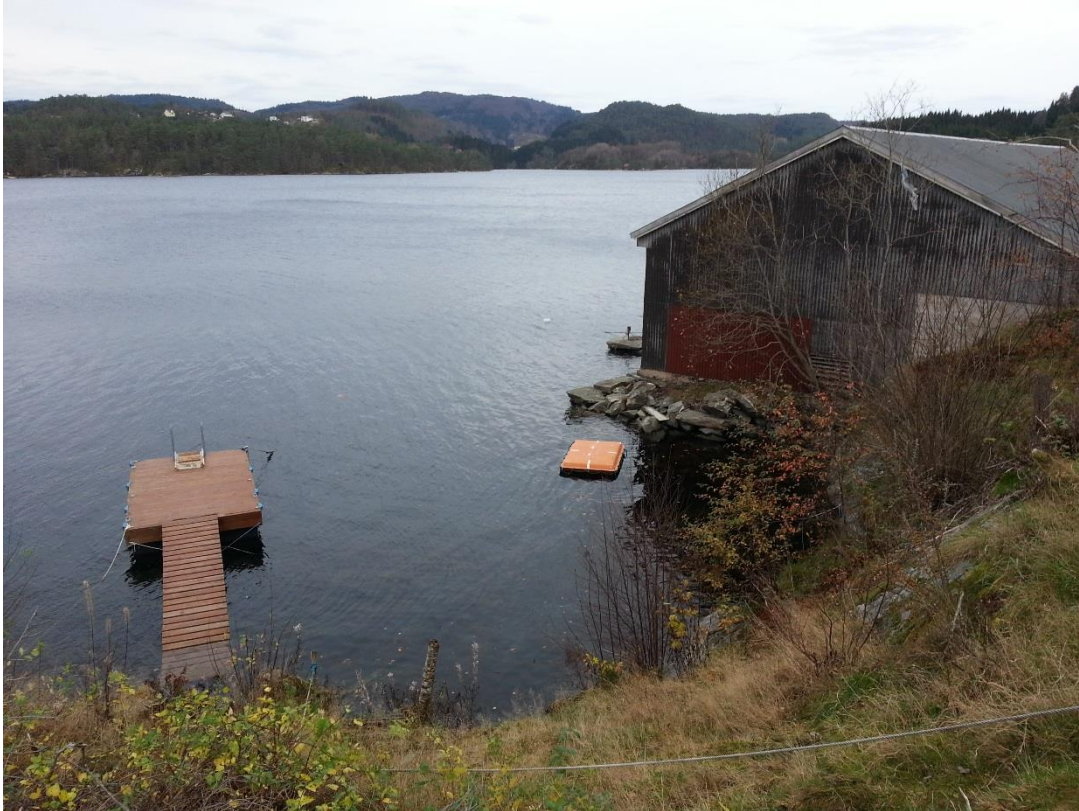
Figur 14 - Nr. 31, sett mot nordvest.