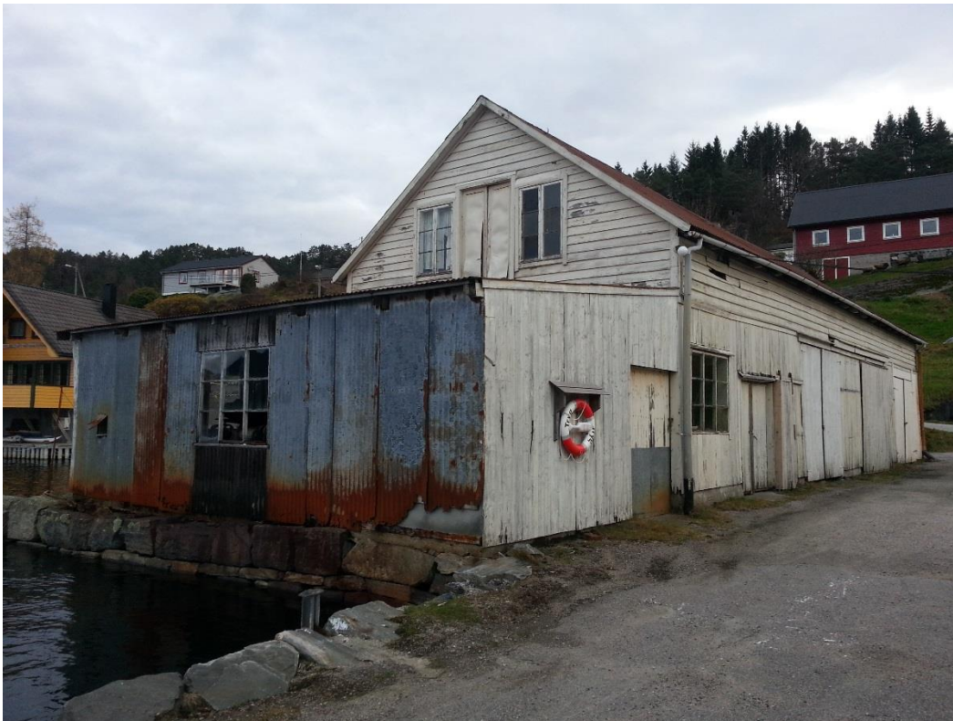
Figur 9 - Nr. 29, sett mot nordaust.