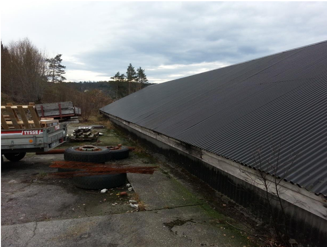
Figur 13 - Nr. 31, sett mot sørvest.