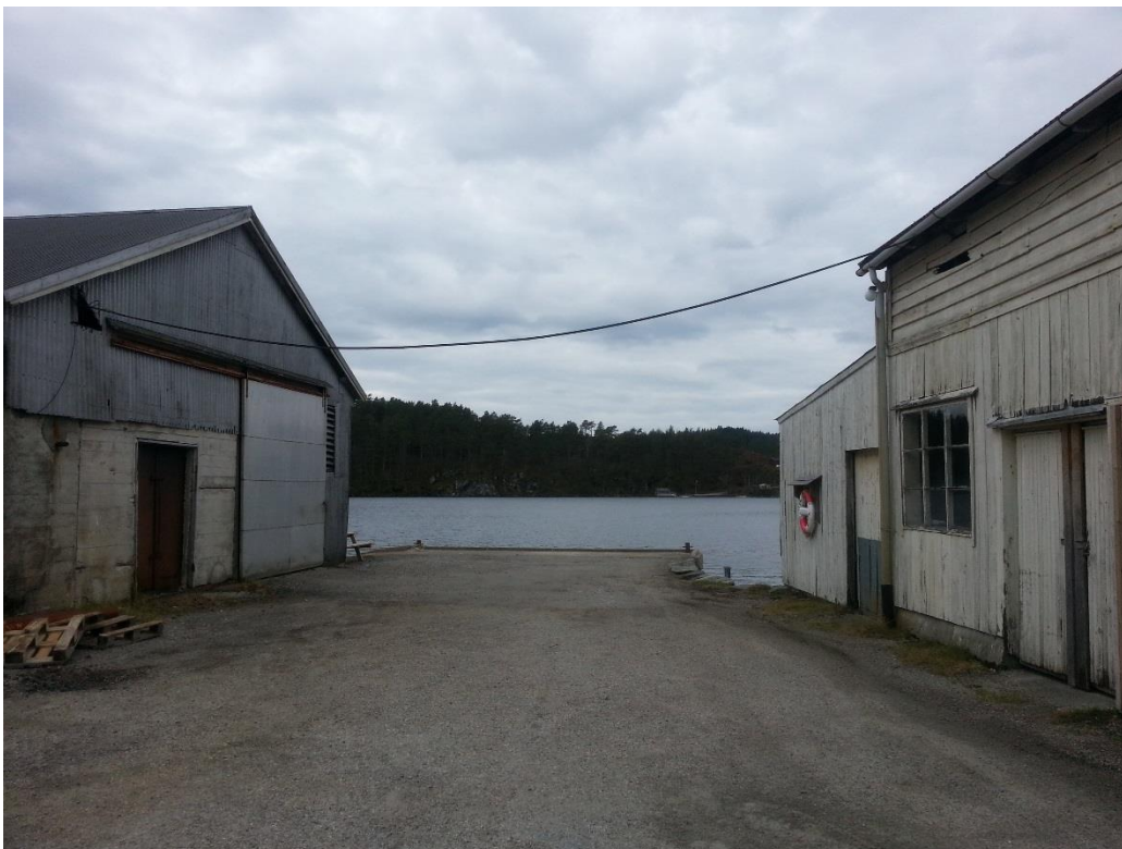
Figur 7 - Kai mellom lagerbygga. Nr. 31 ti venstre og nr. 29 til høgre.