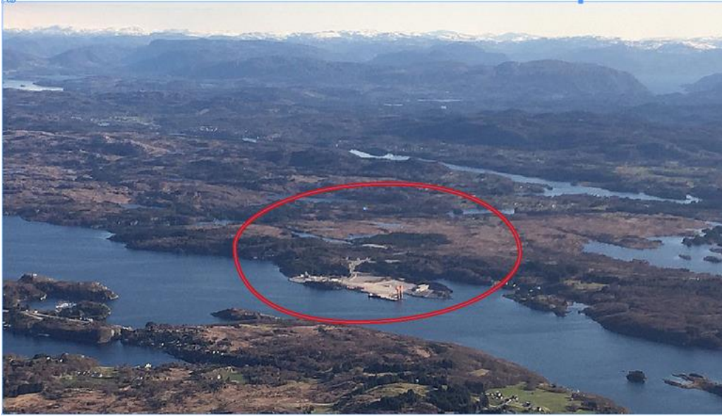
Haugaland Næringspark med kaiområde (Gismarvik).

Kraftbehovet for produksjonsanlegget er vist i følgende 4 ulike scenarier: