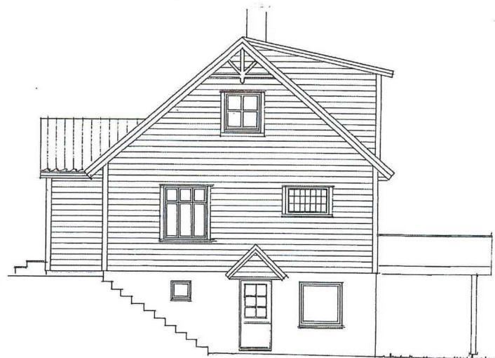
fasade mot NORD-VEST

Gnr. 137 , Bnr. 127 i Lindås kommune , Kubbaleitet 14, 5914 Isdalstø Fasader i Mål = 1 : 100