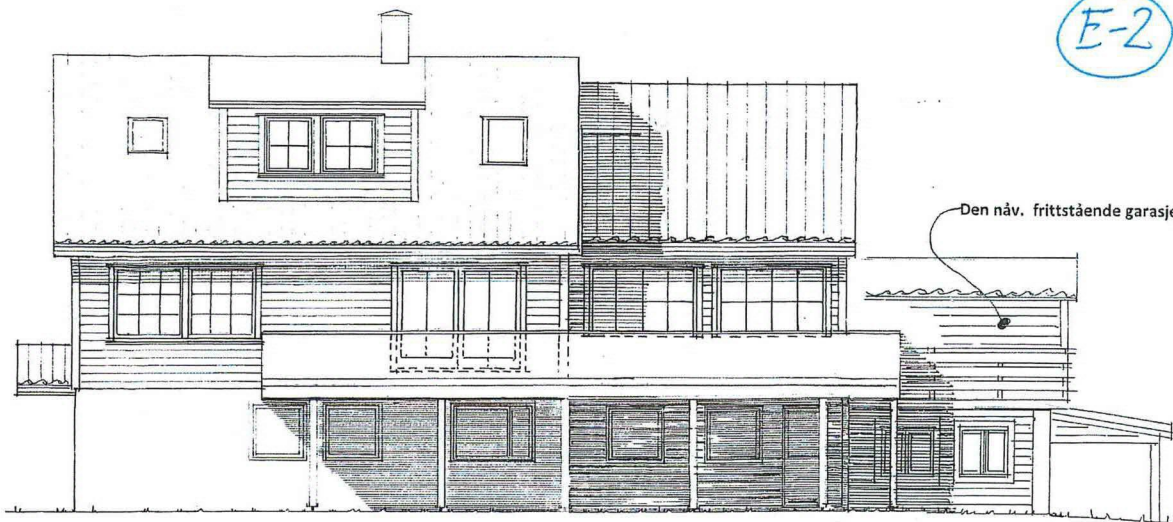
Endret fasade mot SYD-VEST