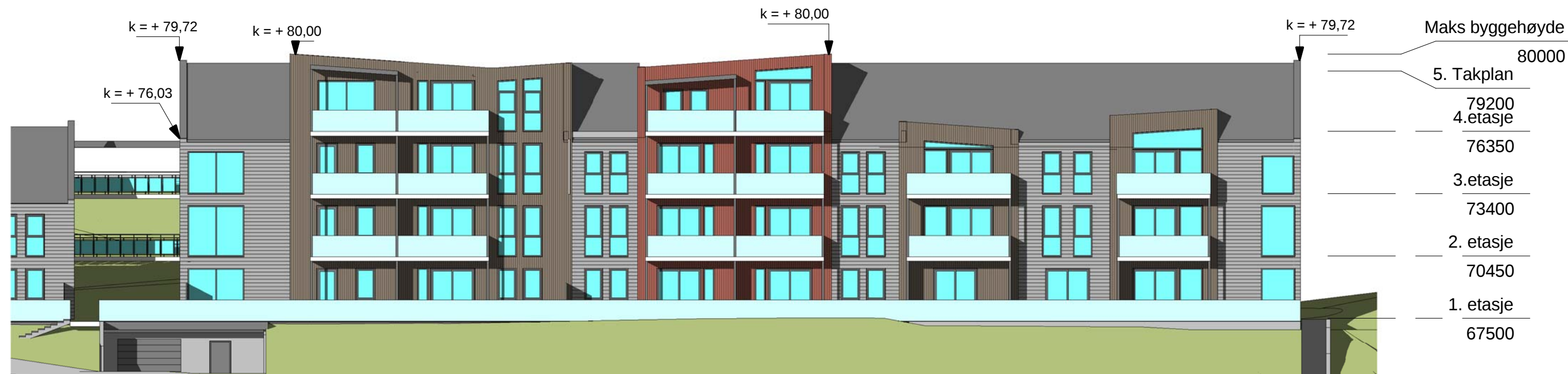
2 Fasade Vest hus A 1 : 200