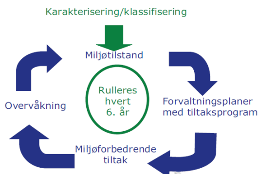
Figur 2. Planhjulet for gjennomføring etter vassforskrifta.