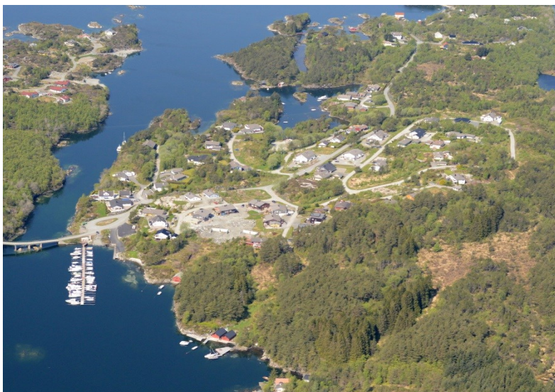
Bustadområdet på Rissundet