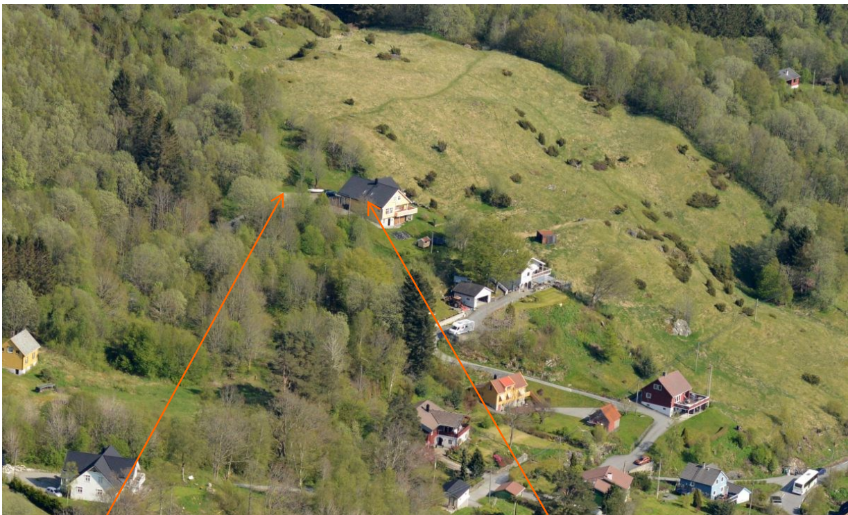
Omsøkt plassering av garasje.