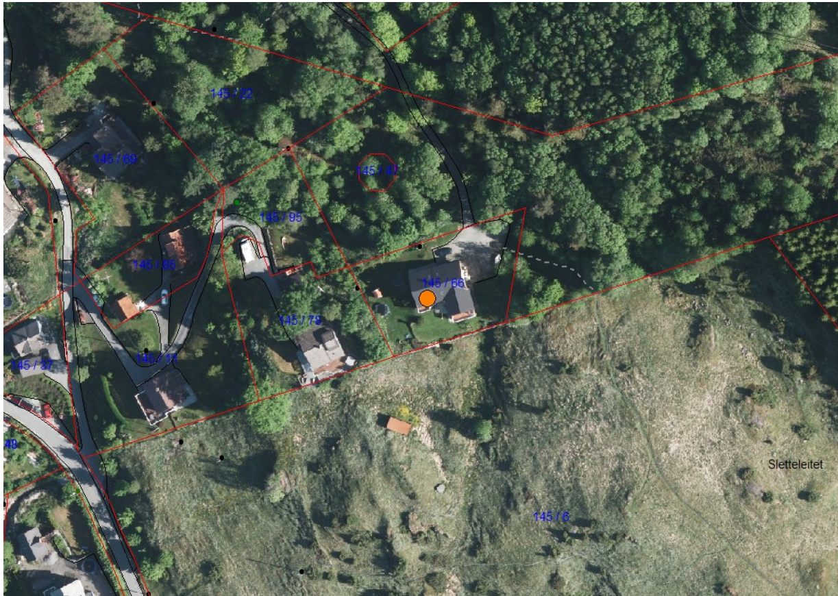
Flyfoto av same område som kartet over syner.