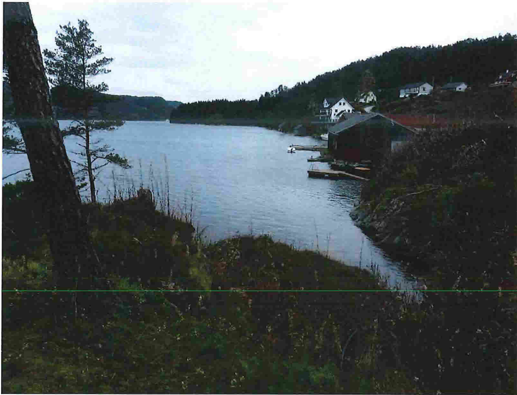
Figur 16 - Framtidig badeplass i vik, sett mot nord. Resten av planområdet i bakgrunnen.