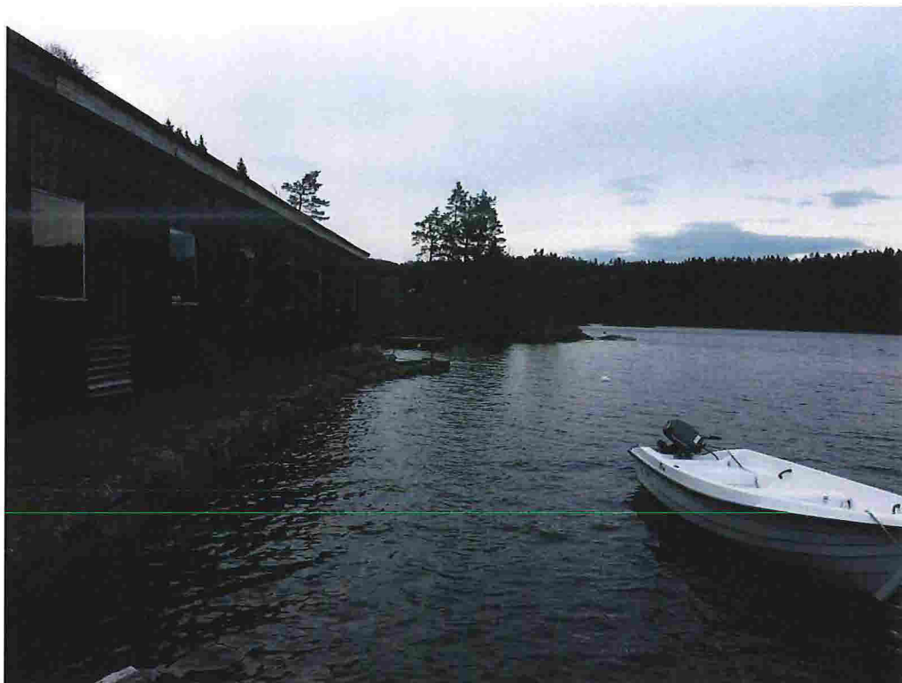
Figur 12 - Nr. 31, sett mot søraust. Framtidig friområde med badeplass i bakgrunnen.