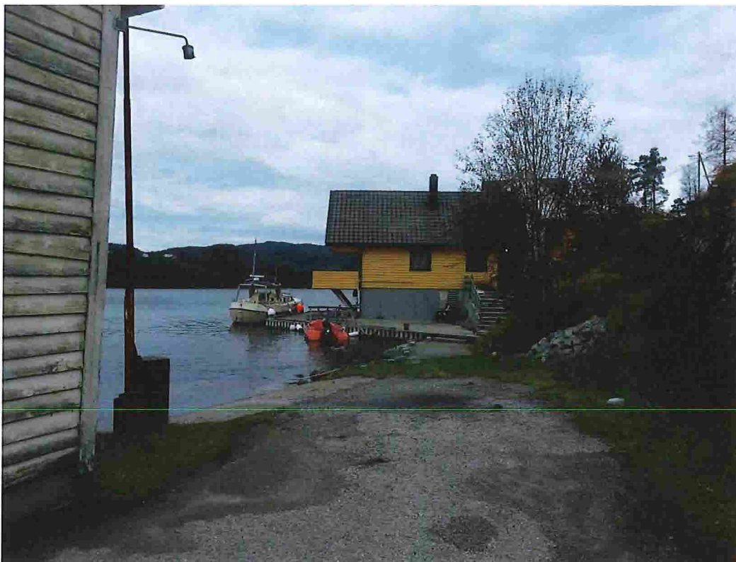
Figur 18 - Bnr. 31 ligg mellom den gule bustaden (nr. 27) og lagerbygningen i nord (nr. 29).