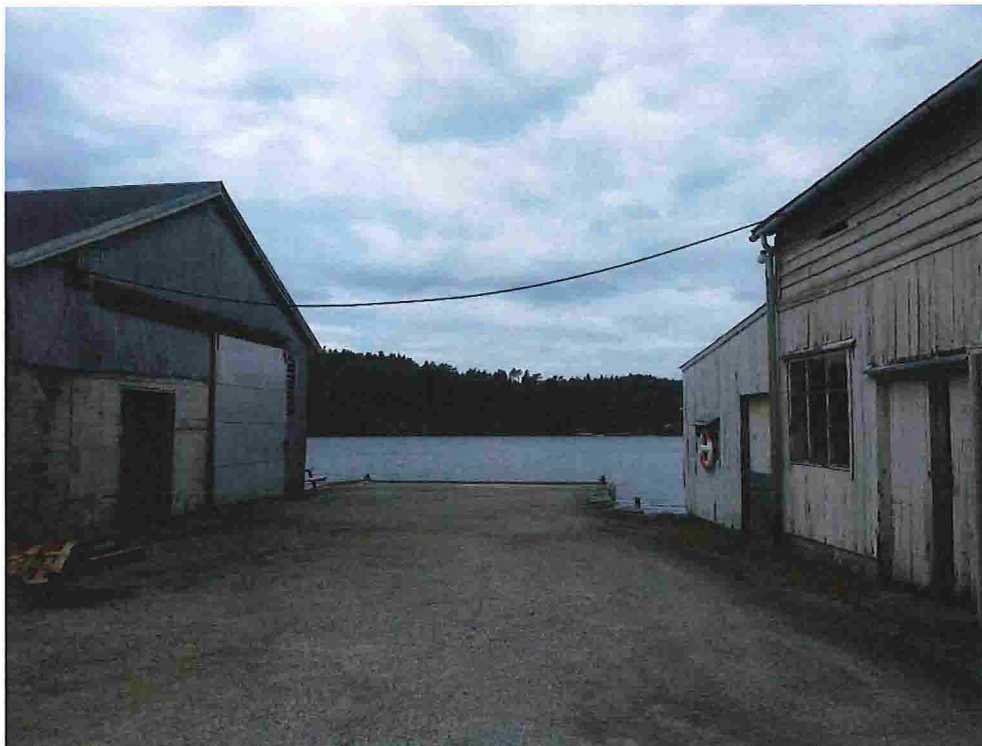
Figur 7 - Kai mellom lagerbygga. Nr. 31 ti venstre og nr. 29 til høgre.