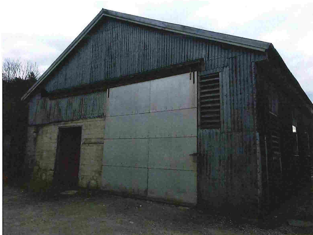
Figur 11 - Nr. 31, sett mot sørøst.