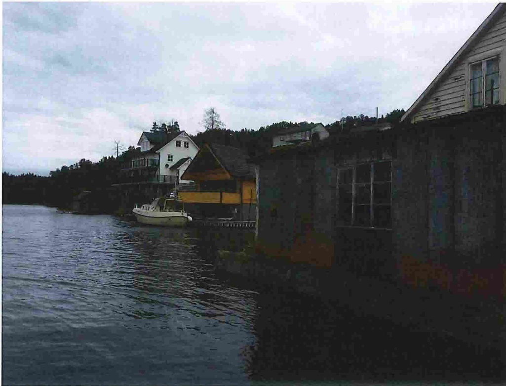
Figur 17 - Bnr. 29 ligg i front av den kvite bustaden (nr. 19).