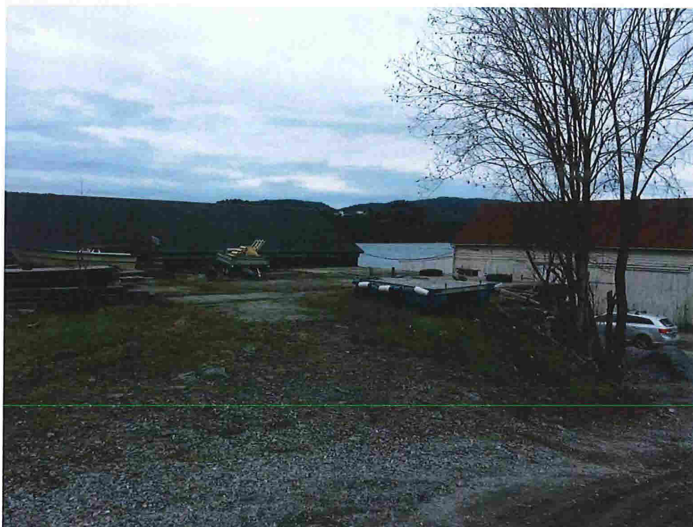
Figur 8 - Dei to lagerbygga. Nr. 31 til venstre, og nr. 29 til høyre.