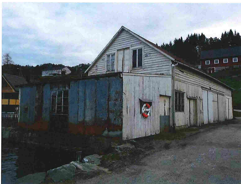
Figur 9 - Nr. 29, sett mot nordaust.