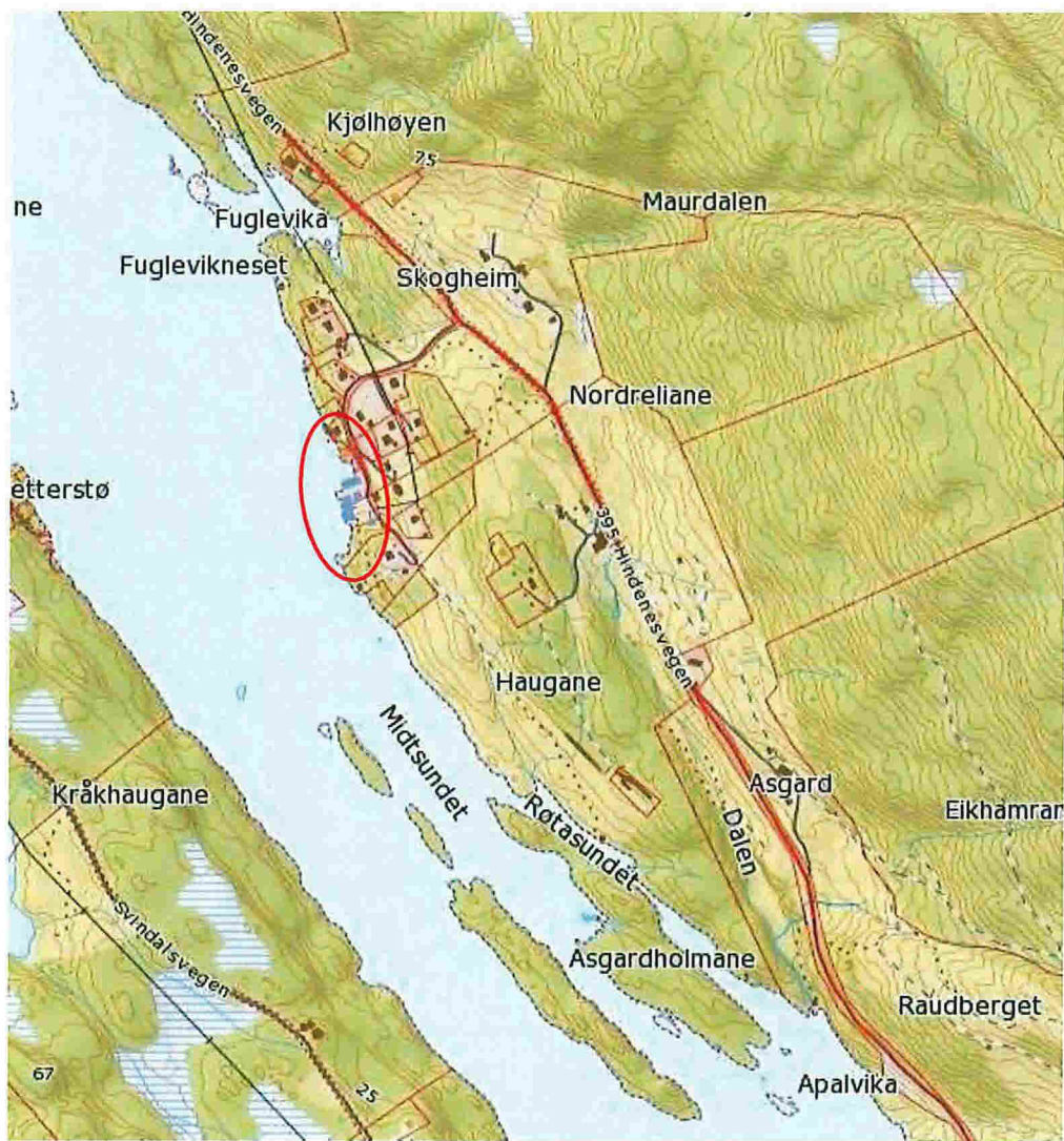
Figur 3 - Oversikt