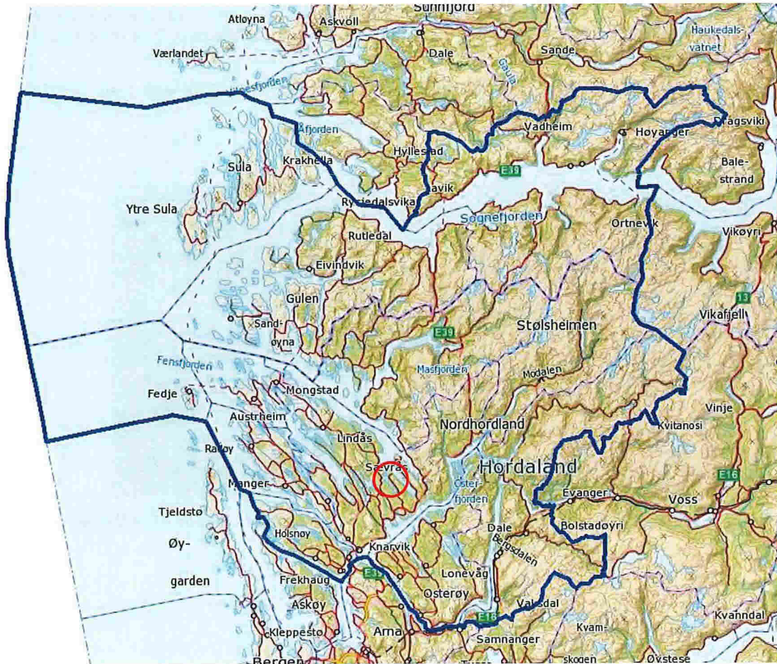
Figur 2 - Oversikt