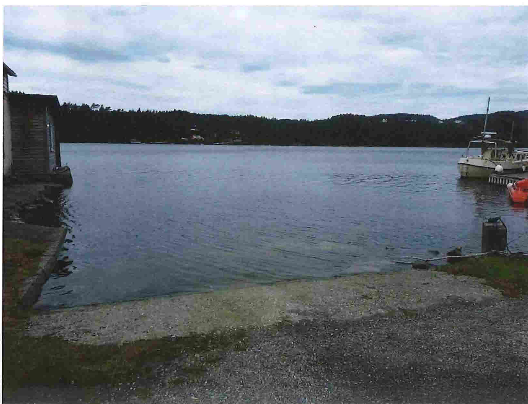
Figur 19 - Bnr. 31.