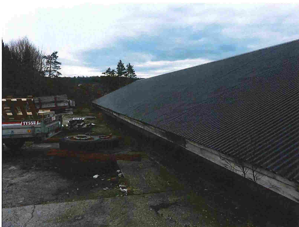
Figur 13 - Nr. 31, sett mot sørvest.