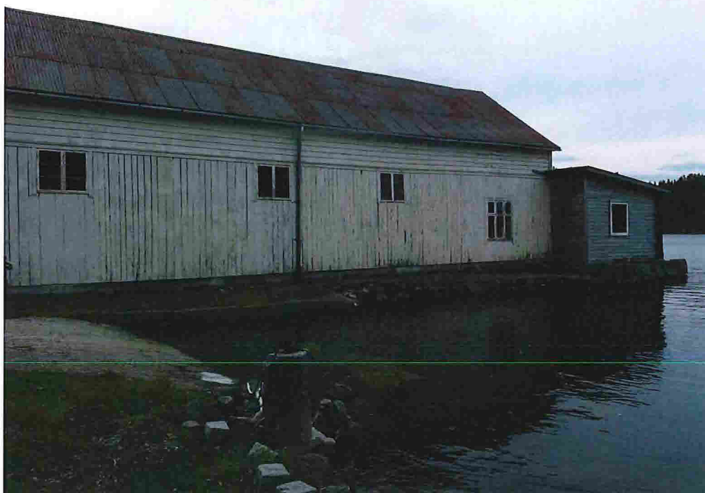
Figur 10 - Nr. 29, sett mot sørvest.