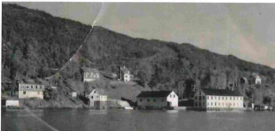
Figur 1 - Åsgard med møbelfabrikk på 1940-tallet.

Det er no eit ønskje om å få rusta opp bygningane og området rundt.