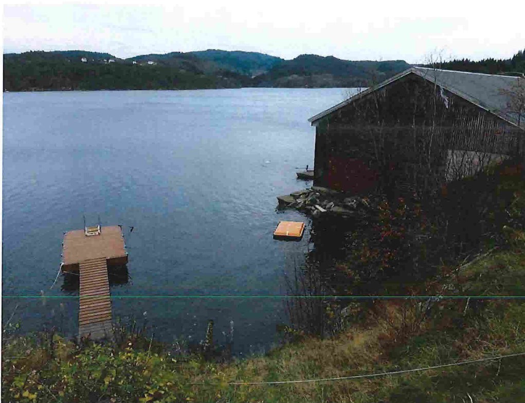
Figur 14 - Nr. 31, sett mot nordvest.