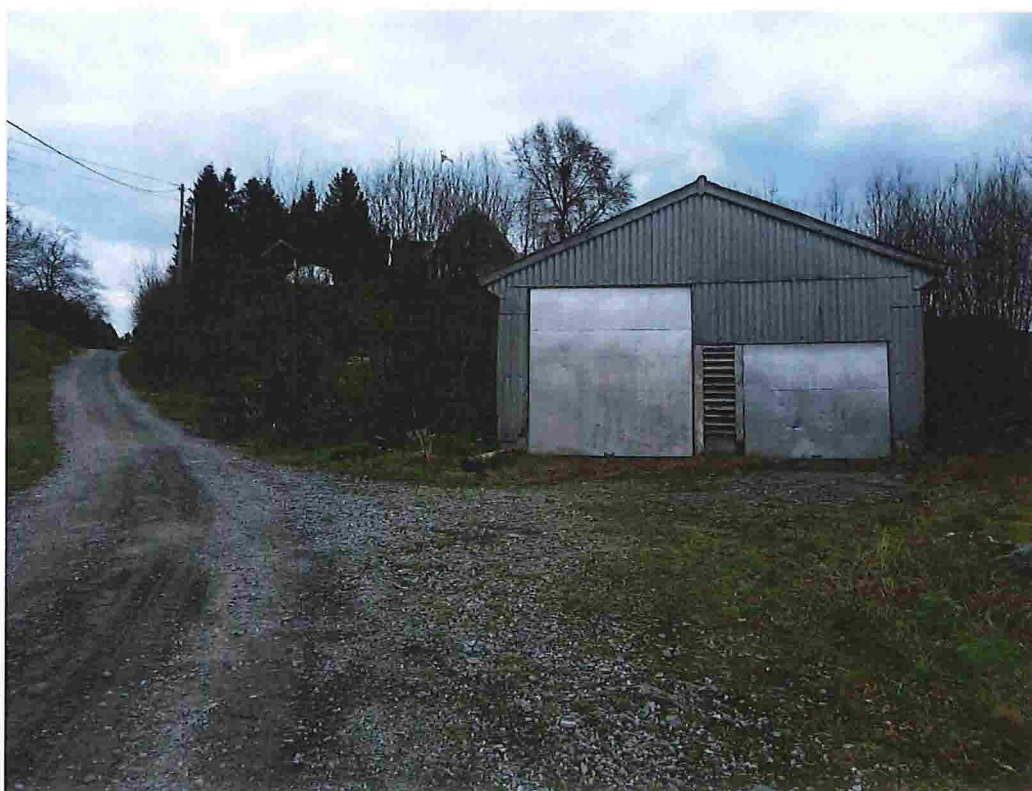
Figur 15 - Garasje som ein vil fjerna. Ein vil byggja ein to einebustader eller ein tomannsbustad på arealet.