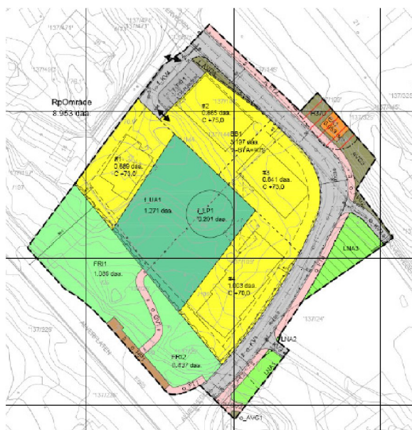
Figur 1: Planforslag, 28 bustader fordelt på fire bygg.

Reguleringsplanen inneholder fire bygninger. Bygninger NR. 1 og 4 er de som er mest utsatt for trafikkstøy, fra FV 565 Alverflaten.