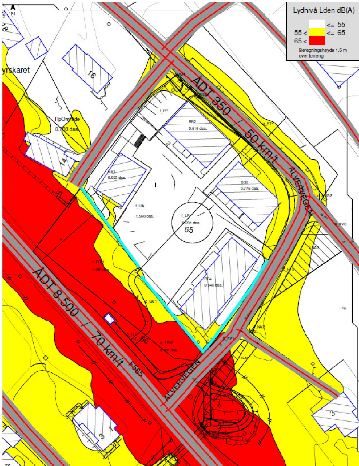
Figur 3: Fremtidig situasjon med støyskjermingstiltak.

Fremtidig situasjon med tiltak og med trafikk tall for år 2023. Støysonekart for skjernet fremtidig situasjon vises i figur 3.