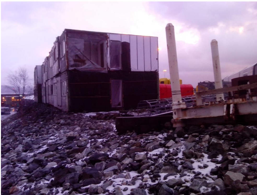
Disse brakken har stått så lenge at de nå er utdatert og kommer aldri mer i bruk. Det er kostbart for eier å få dem fjernet