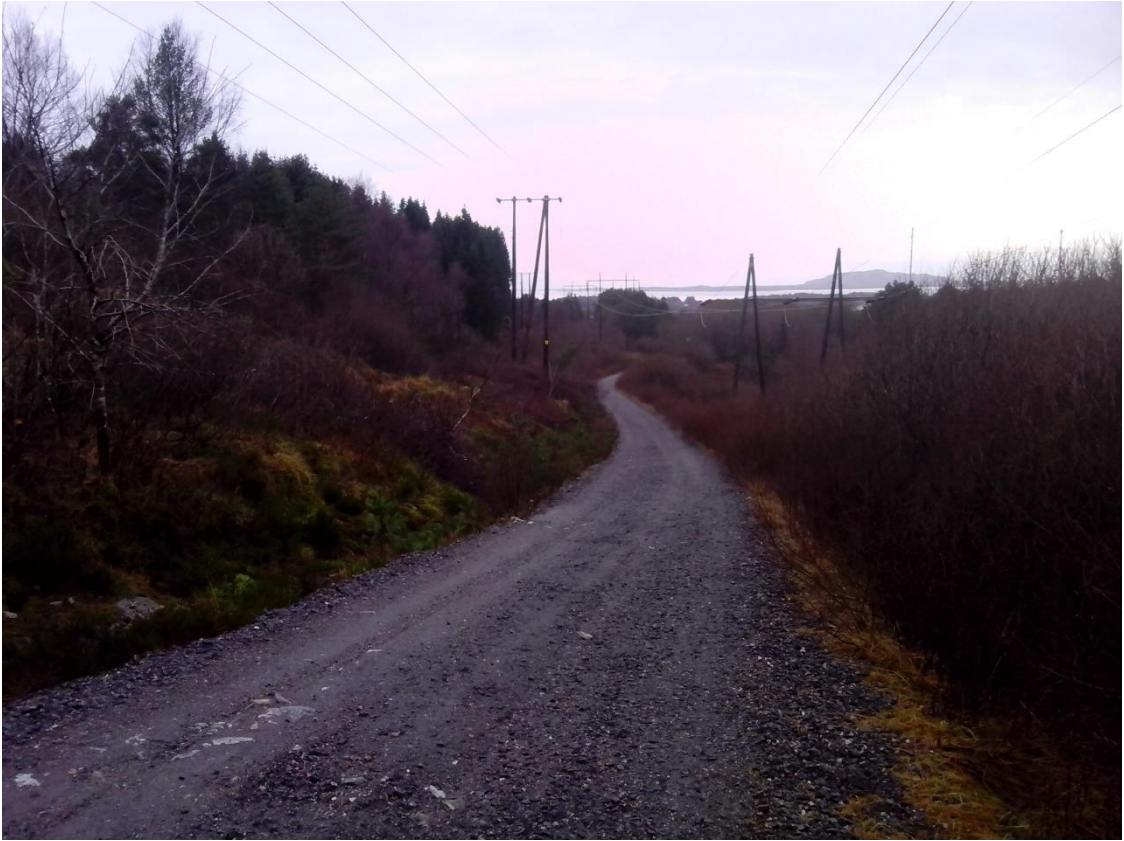
Grense mellom industri og natur/buffersone bør gå langs eksisterende høyspentlinjer