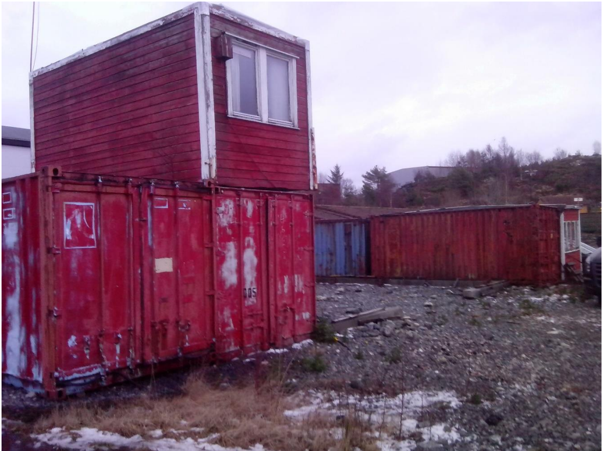
Typiske ting som lagres på lagerplasser i utkanten. Dette har stått i mange år.