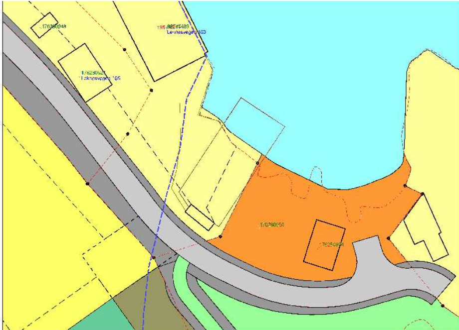
Figur 2: Eksempelet

viser korleis byggegrensa i kommuneplanen (blå stipla linje) er sett langs loddrett mur ned mot slipp. Strandsona er her avsett til sjøretta bruk som slipp og naust. Bygegrensa som ligg i planforslaget til regulering kryssar tvers igjennom dagens slipp.