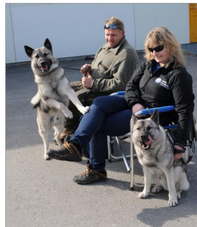
Utstilling HEK uskedalen 2013

I Kvinnherad samarbeidar elghundklubben med Kvinnherad ettersøkslag og har i denne samanhengen tilgang til terreng der ettersøkslaget har avtale om ettersøk.