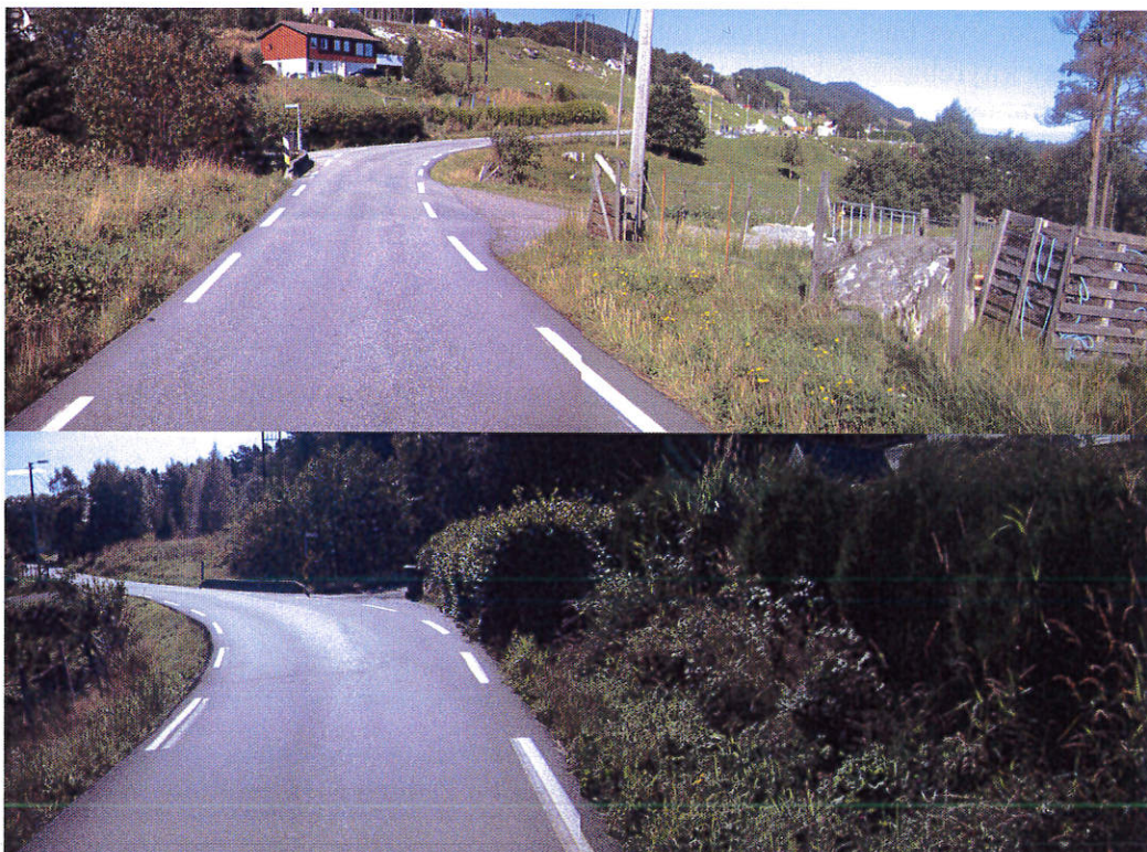
Vegbiletet viser at hekk og krattskog hindrar frisikt.

Som opplyst i vår uttale, oppfyller den aktuelle avkøyrsla per i dag ikkje krav til frisikt. Vegetasjon må fjernast i begge siktretningar for at siktkravet skal oppfyllest. Nord for avkøyrsla må hekk beskjerast. Sør frå avkøyrsla må noko krattskog fjernast.