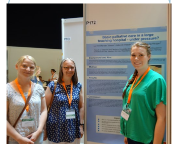
Posterpresentasjon på EAPC World Research Congress i Lleida, Spania, juni 2014

Kompetansesenteret hadde i 2014 7 årsverk fordelt på ein tverrfagleg stab av 21 tilsette. Seks tilsette arbeider i den sentrale eininga på Haukeland universitetssjukehus, dei andre er deltidstilsette som i si hovudstilling arbeider med lindrande behandling i sjukehus og kommunar i regionen.