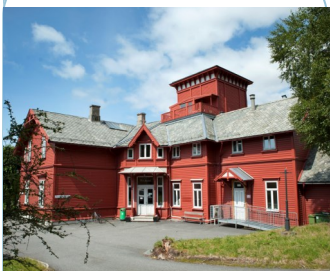
Haukelandsbakken 2, Haukeland universitetssjukehus