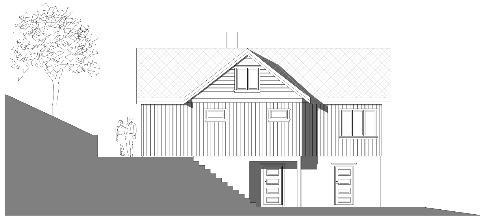
Fasade mot nord