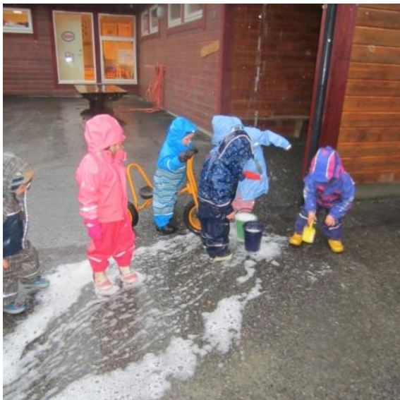
Barna samarbeider med å samle vann i bøtten

Samspill skjer, ifølge hefte ”barns sin trivsel- voksne sitt ansvar” fra utdanningsdirektoratet, i omsorgssituasjoner, lek og læringssituasjoner. Med andre ord, i alle daglige situasjoner i barnehagen. Gjennom samspill med andre utvikler barn blant annet evnen til å reflektere over egne handlinger og væremåter. Å oppleve mestring i samspill med andre er en viktig del av hverdagen.