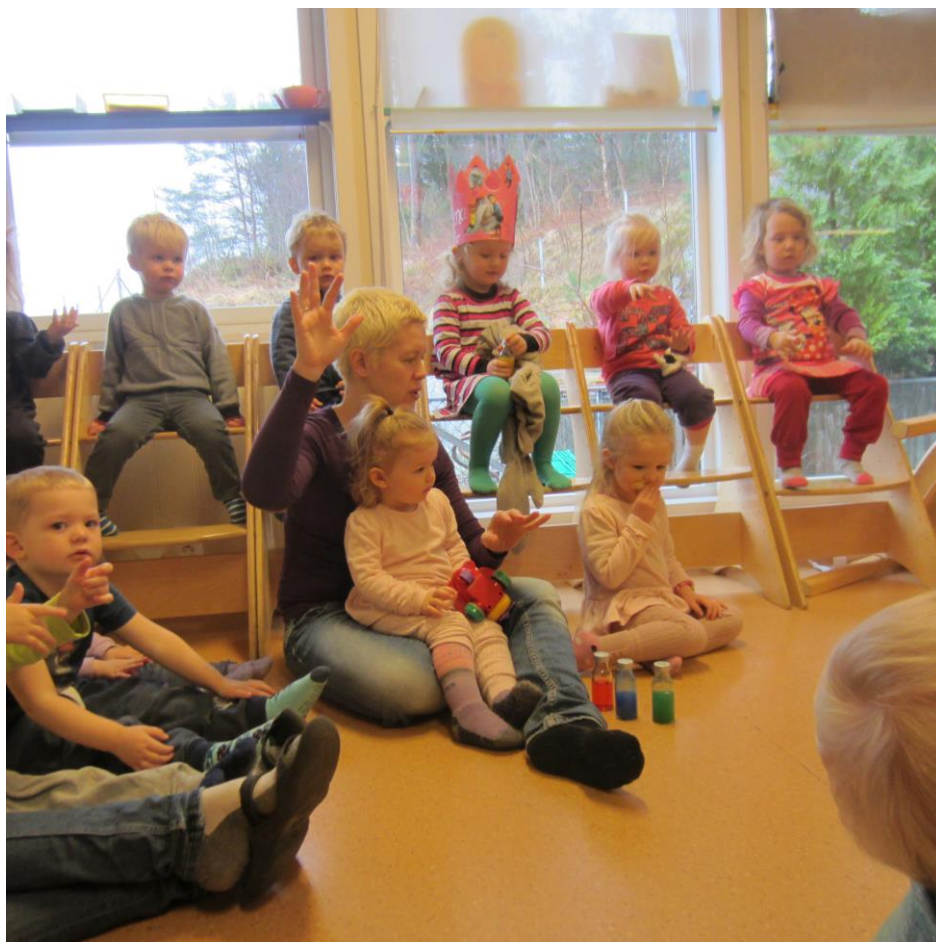
Fellessamling på bademyggen