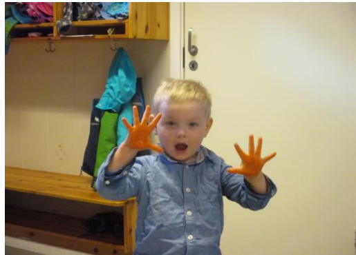
Matheo malar hender