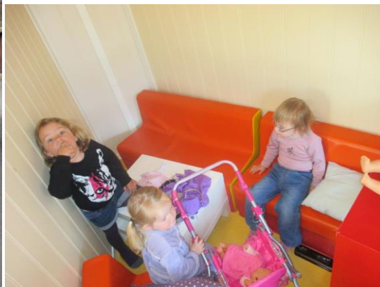
Leik og glede