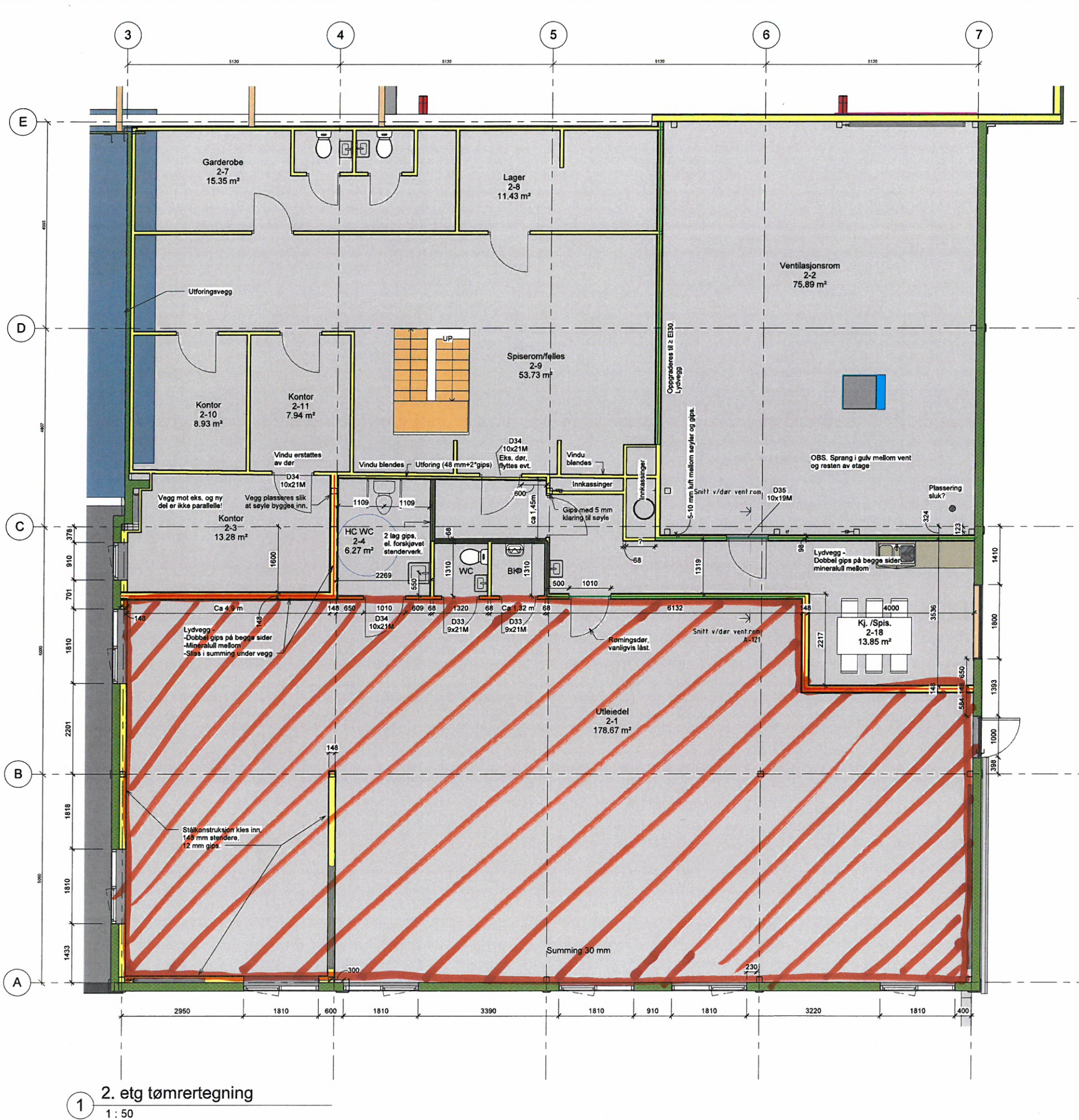
1 2. etg tømrertegning 1 : 50