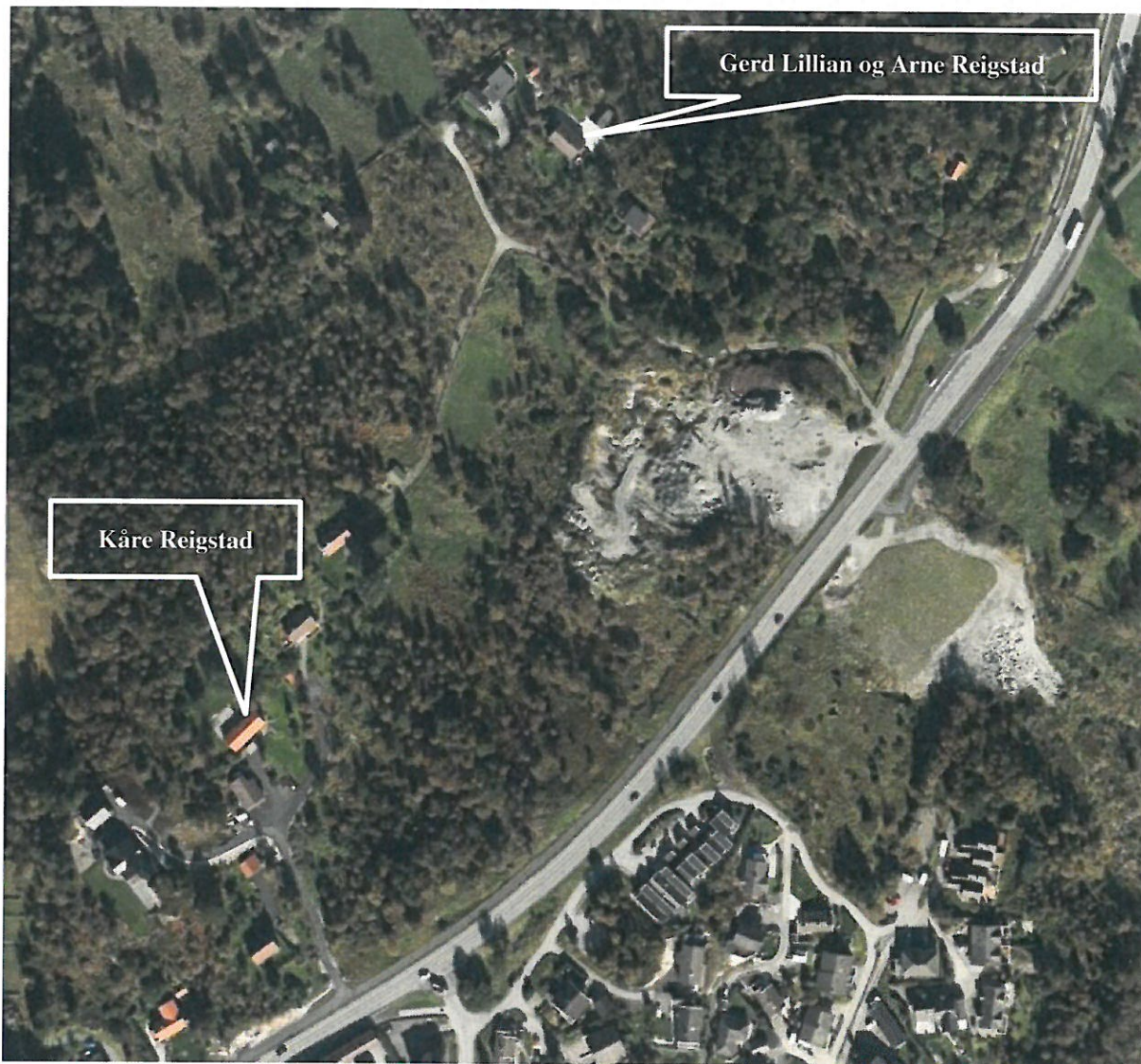
Flyfoto Gjervikflaten med lokalisering av merknadsstillarane