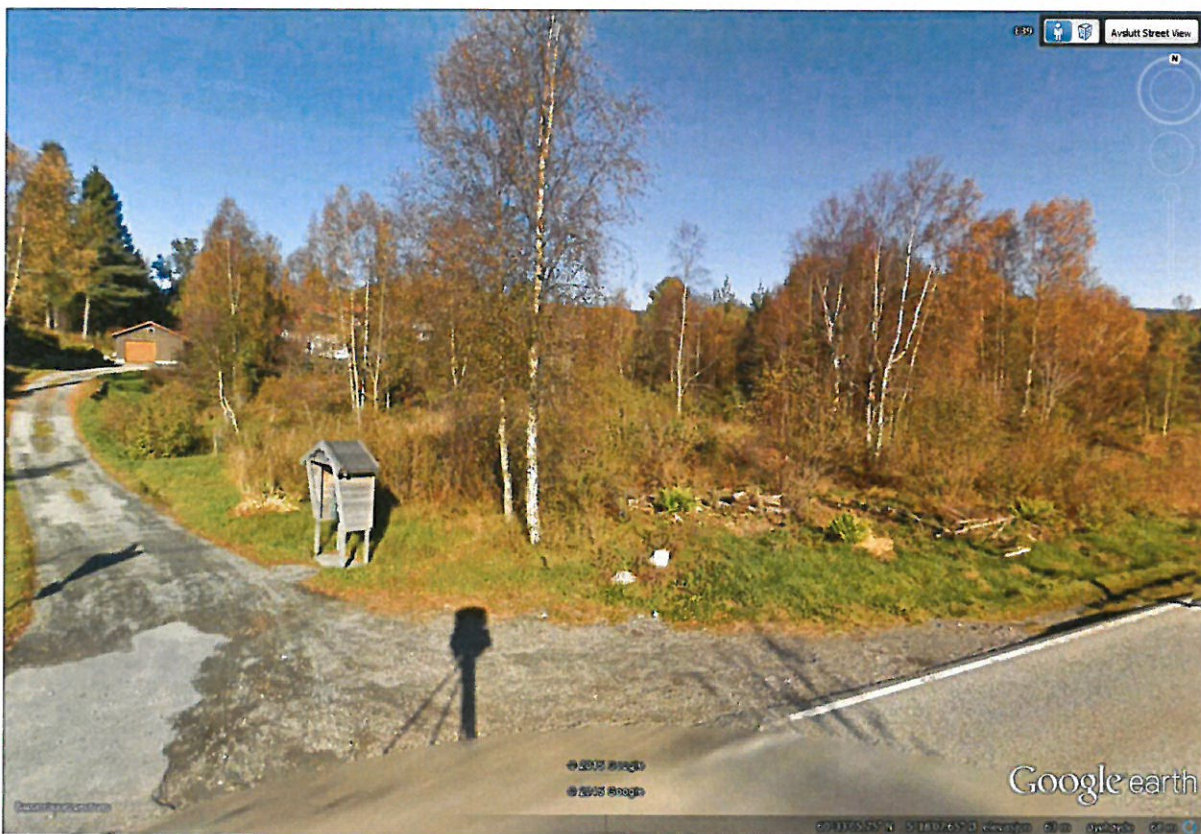
Adkomstvegen opp til nr. 124 m.fl. Skogsområdet til høgre i bilete.

Vi kan heller ikkje sjå at merknadstillar har nemneverdige ulemper av at det står ein lagerhall på deponeringsarealet fram til arealsituasjonen er avklara. Arealet på Gjervikflaten kan naboen knapt sjå frå huset sitt på grunn av skogen mellom bustaden og hallen – jf. bilete som følgjer: