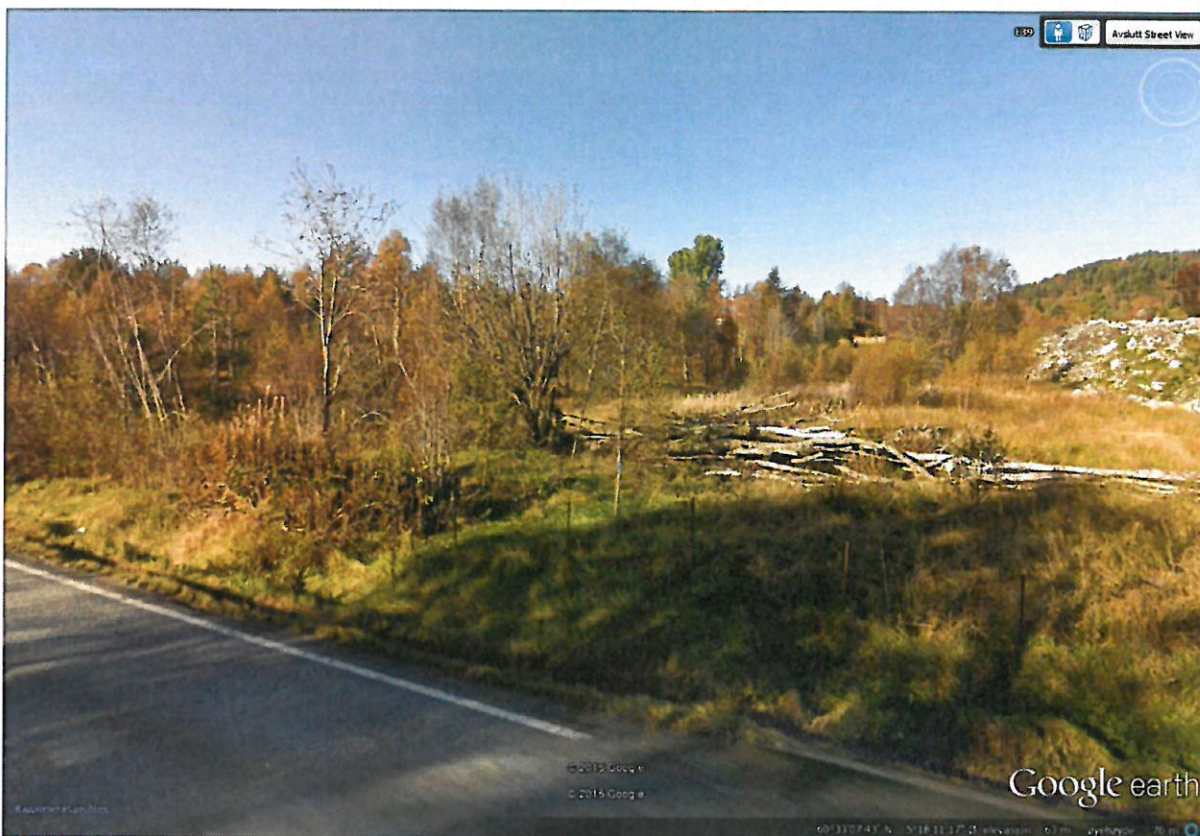
Foto frå E 39 mot bustadene vest for Gjervikflaten (nr. 124 m.fl.) Jord og steinhaul lengst vest på deponiområdet er synleg til høgre i bilete.