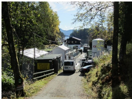
Anlegget ved Sauvågen

Bilde teke av Fylkesmannen ved tilsyn den 14. oktober 2015.