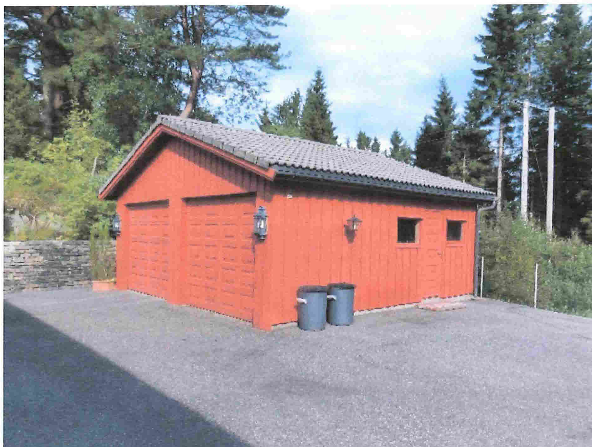
Bilde av oppført garasje, Tveitastø 24, 5913 Eikangervåg.