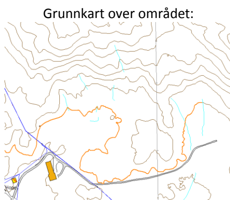
Situasjonsplan som viser plassering av massar:

Gjennomsnittlig fyllhøgde er ca 4 meter, og maksimal fyllhøgde ca 8 meter. Vollen mot vest vil bli ca 3 meter høg.