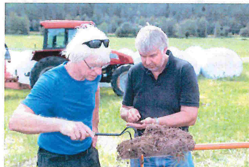
Rådgiverne studerer jordstruktur