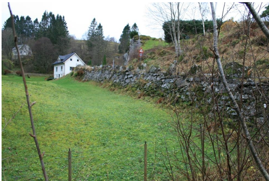
Figur 1 Fylkesveg - mur

Bnr 3 vart oppretta 1849 utskilt frå bnr 2.