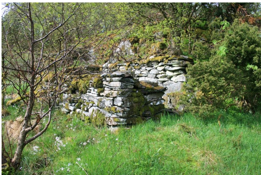
Figur 2 Gardflor

Innafor reguleringsområdet er det få synlege restar etter tidlegare drift og bruk av landskapet. Det står murrestar etter det som har vore gardflor på bnr 3. Tidspunkt for oppføring er ukjent.