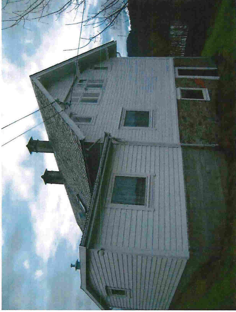
Nåv. fasade mot NORD-VEST (del av «tilbygg» mot NORD-AUST)