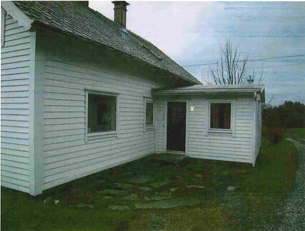
Nåv. langside mot NORD-AUST , tilbygg mot SØR-AUST