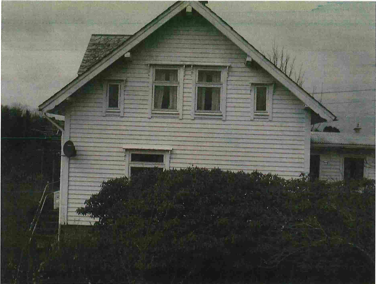
Nåv. gavlfasade mot SØR-AUST