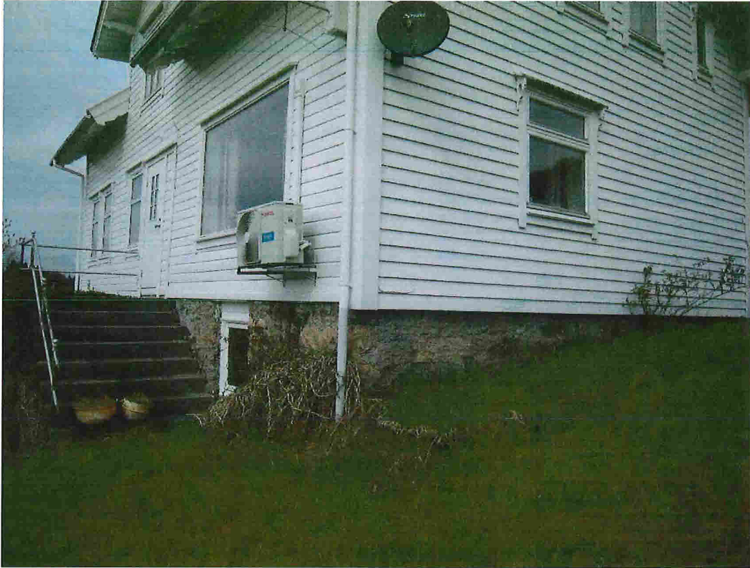
Nåv. langside mot SØR-VEST , gavlfasade mot SØR-AUST

Nåværende fasader for våningshuset , Gnr. 176 , Bnr. 3 i Lindås kommune