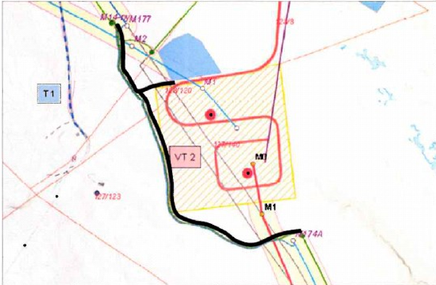
Vedlegg 1: Permanent anleggsvei ved Lindås transformatorstasjon