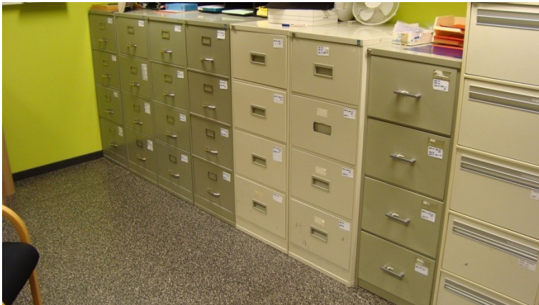
Bilde. Perioden 2011 - 2014

Det er uklårt kor mange mapper dette utgjør. Ventearkivet er plassert i to arkivskap med fem skuffar i kvart skap.