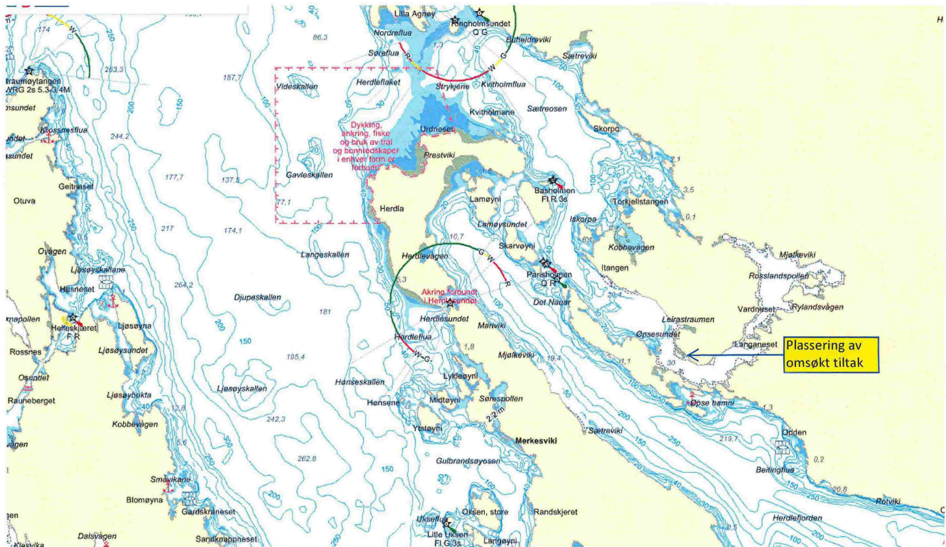
Gnr. 49 bnr 140, Meland Oversiktskart, ref.: sjøkart nr. 23 Vedlegg til søknad om flytebrygge Dato: 30.03.2014 Vedlegg D1