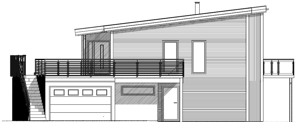
FASADE MOT NORD-VEST