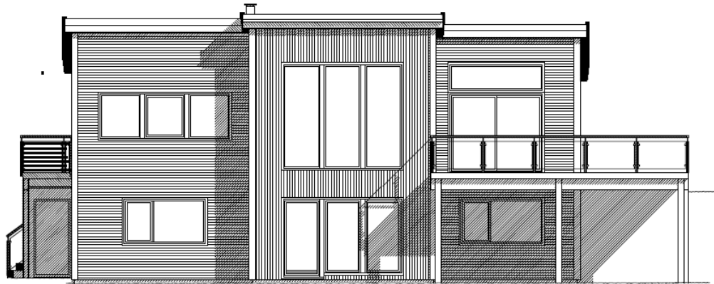
FASADE MOT SØR-ØST