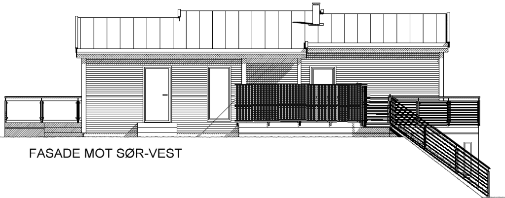
FASADE MOT SØR-VEST