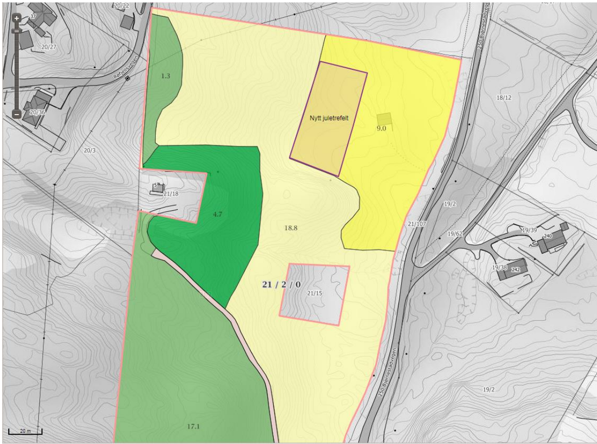
Nytt areal litt tett ved Bjørnestadvegen.