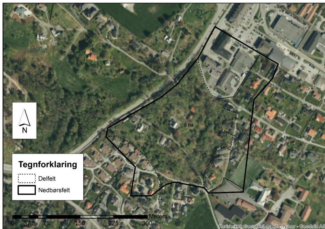
Figur 3-1: Flyfoto over området- Figuren viser nedbørfeltets delfelt med hensyn på avrenningskoeffisienter.

Nedbørfeltet er delt og består av noe sentrumsområde, noe bebyggt område med stort sett eneboliger, og mest skog sentralt i området. Figur 3-1 viser flyfoto over området. Vi har delt inn området i fem delfelt i tre subkategorier. Tabell 3-1 oppsummerer beregningene. Nedbørfeltets nåværende, gjennomsnittlige avrenningskoeffisient er 0,57.