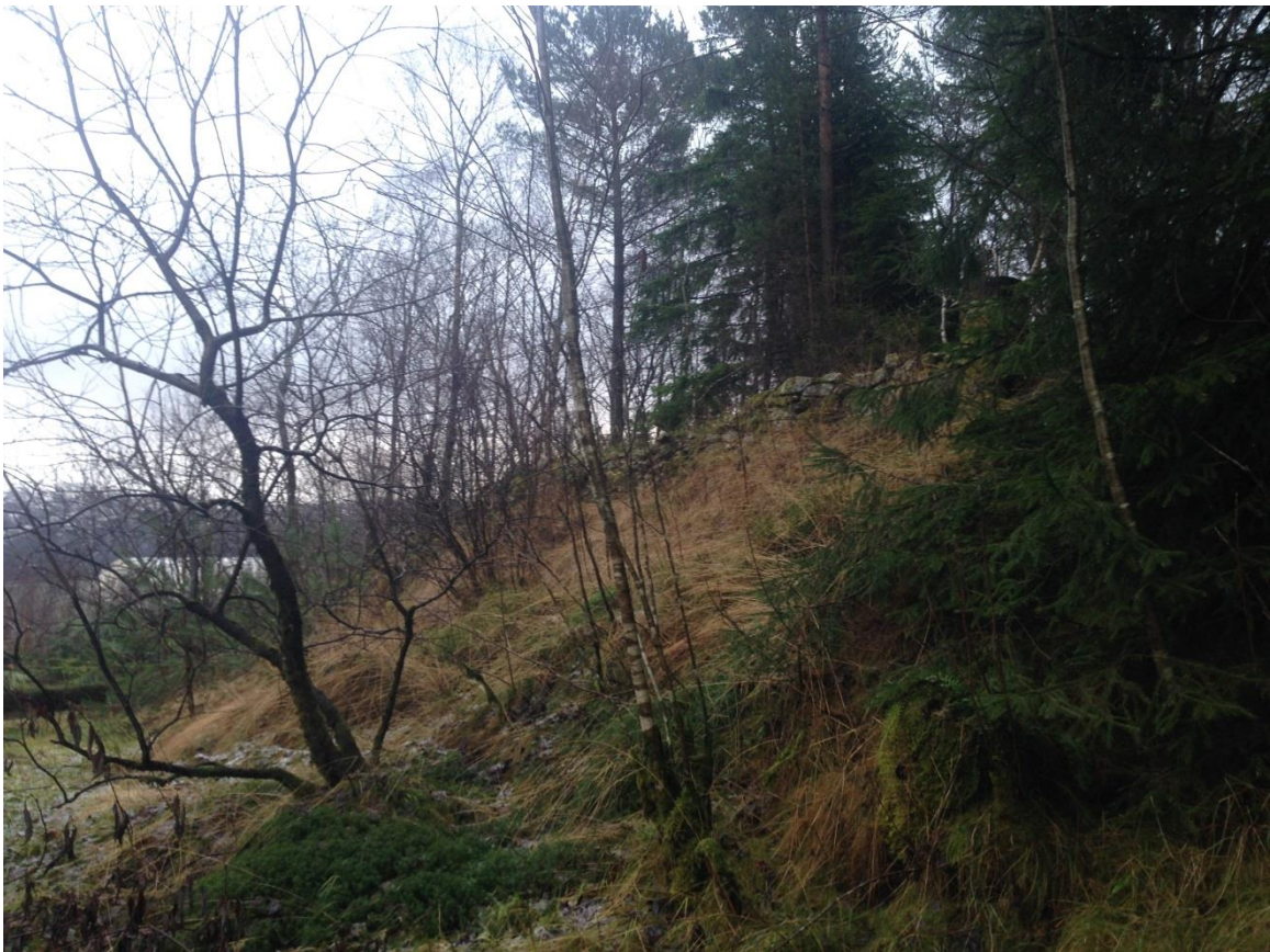
Foto 10. Steingard i grensa mellom 22/104 og 22/79. SA