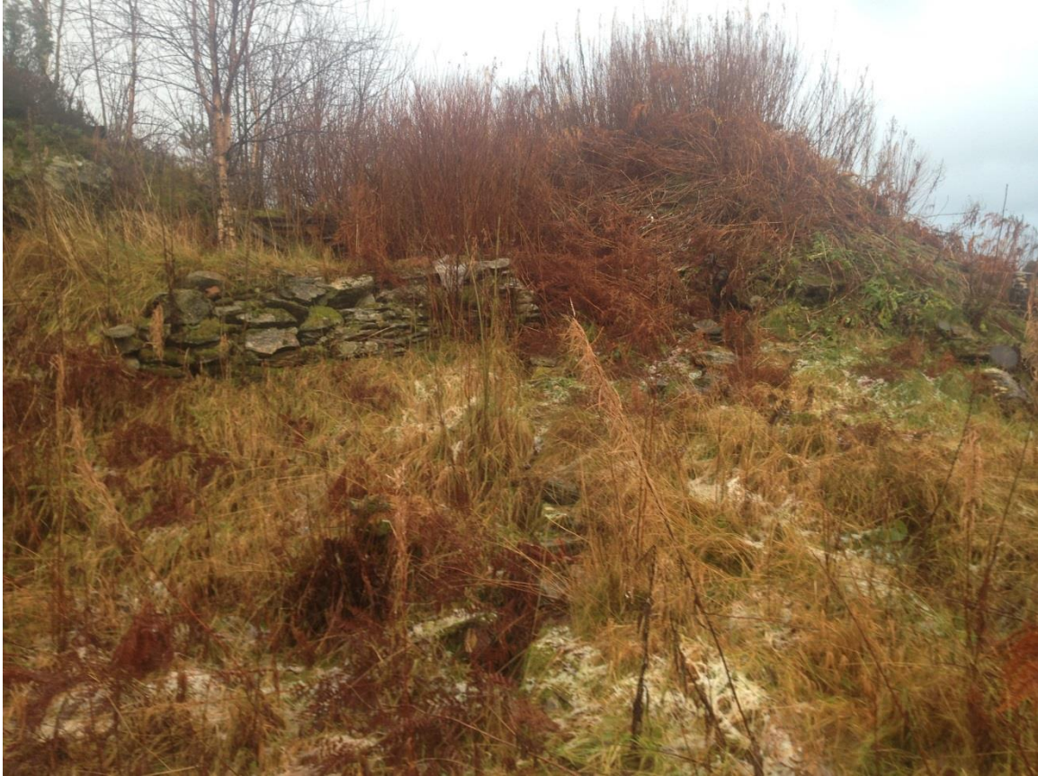
Foto 7. Restar etter tørrmur og oppmurt eldre vegfar på 22/69. NV