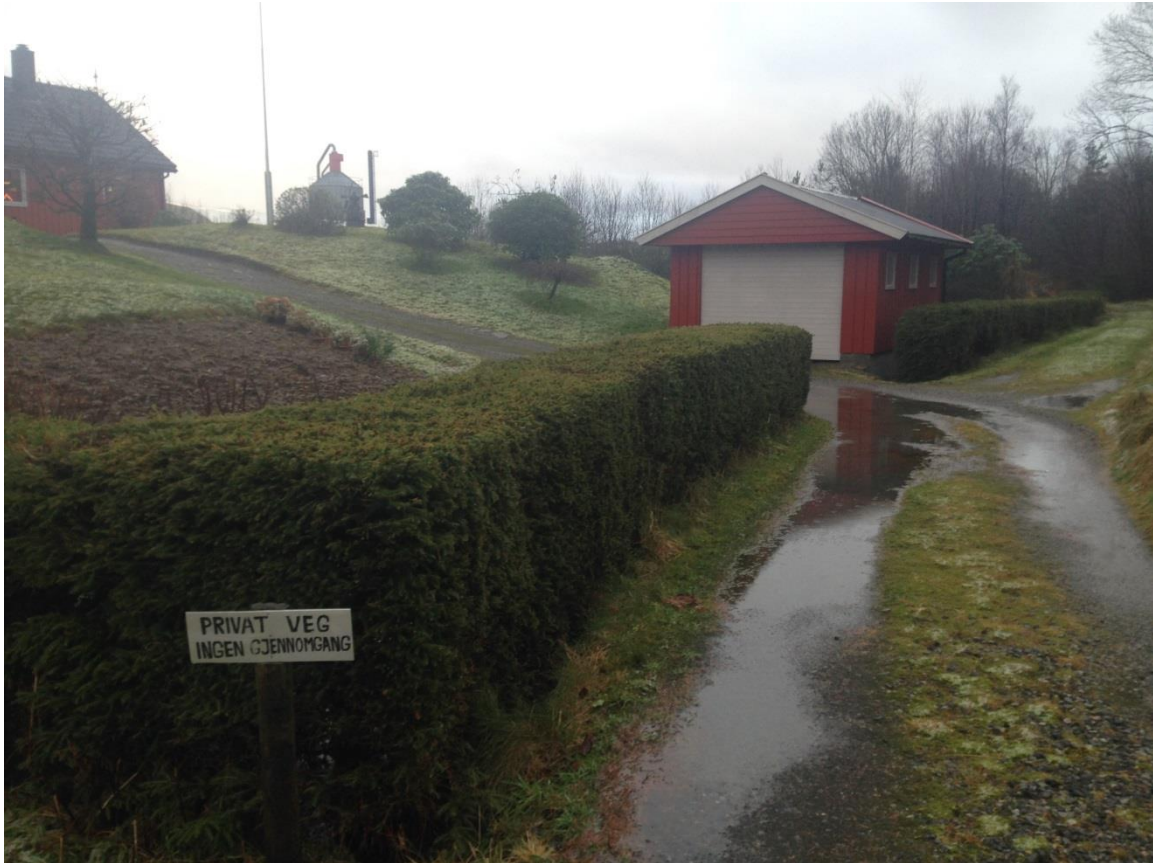
Foto 1. Inngang frå Rosslandsvegen. S