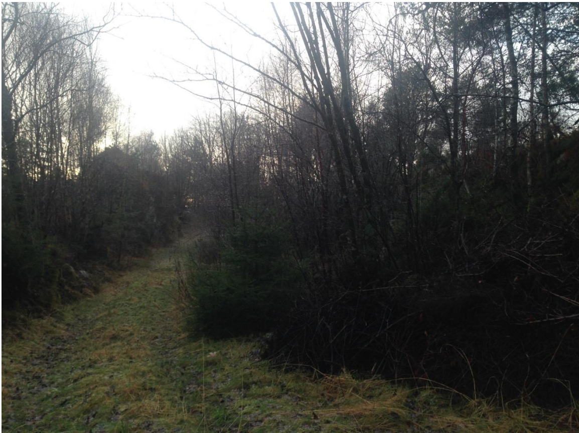
Foto 4. Gjennomgåande vegfar. S