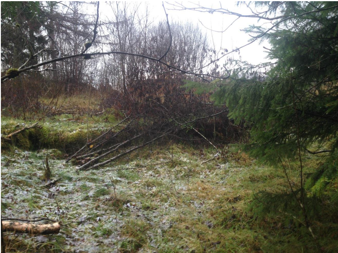
Foto 8. Vegfar på 22/79. A