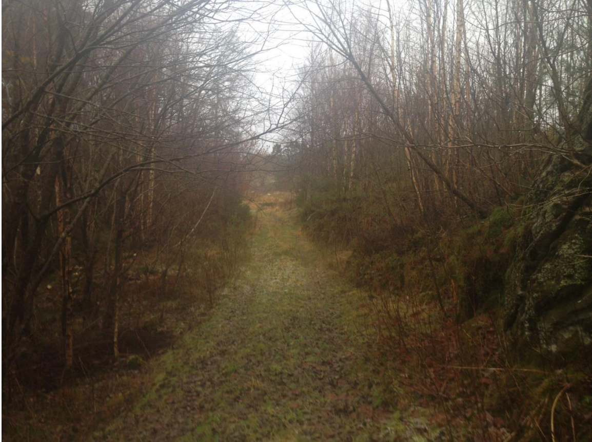
Foto 3. Gjennomgåande vegfar. N