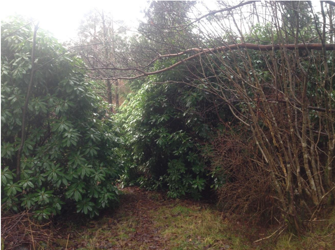
Foto 6. Gjennomgåande vegfar i grensa mot 22/85. SV