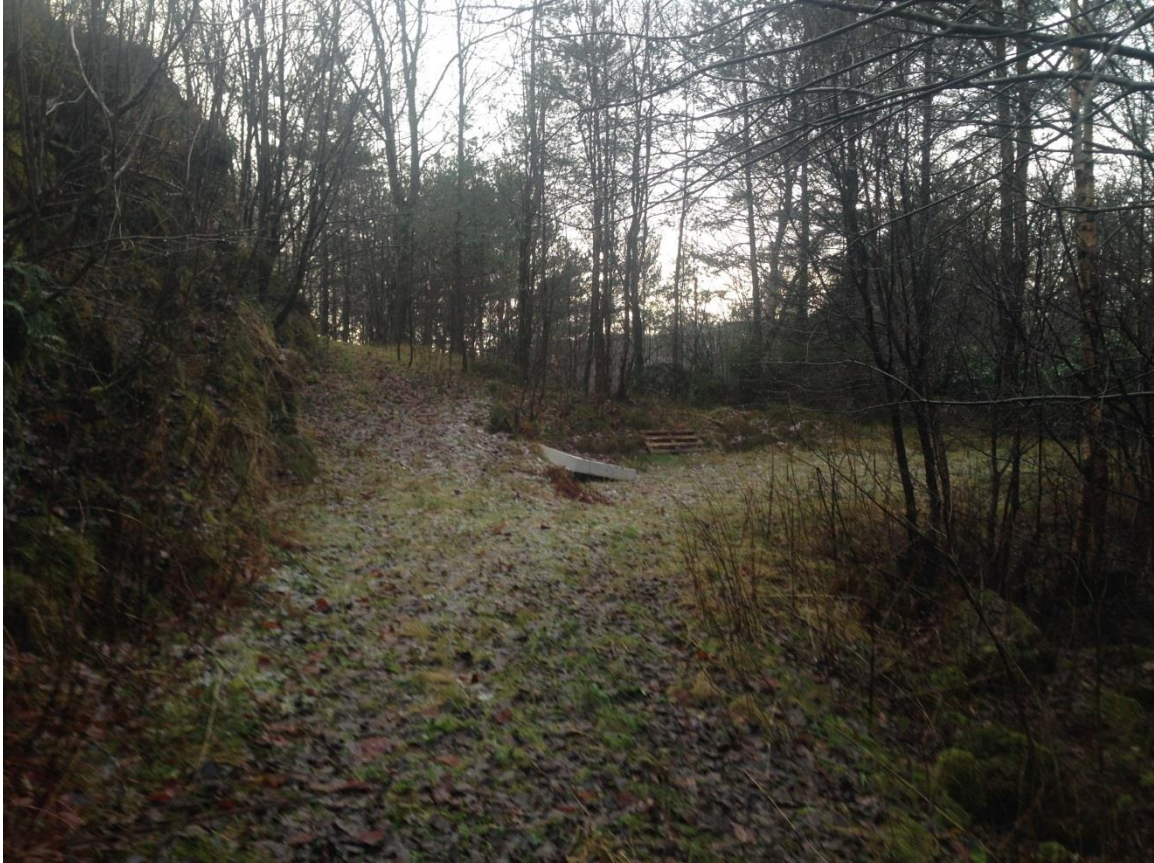
Foto 5. Gjennomgåande vegfar mot høgre. Vegfar i retning 22/69 mot venstre. S