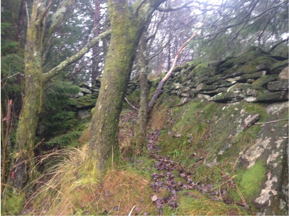
Foto 9. Steingard i grensa mellom 22/104 og 22/79.