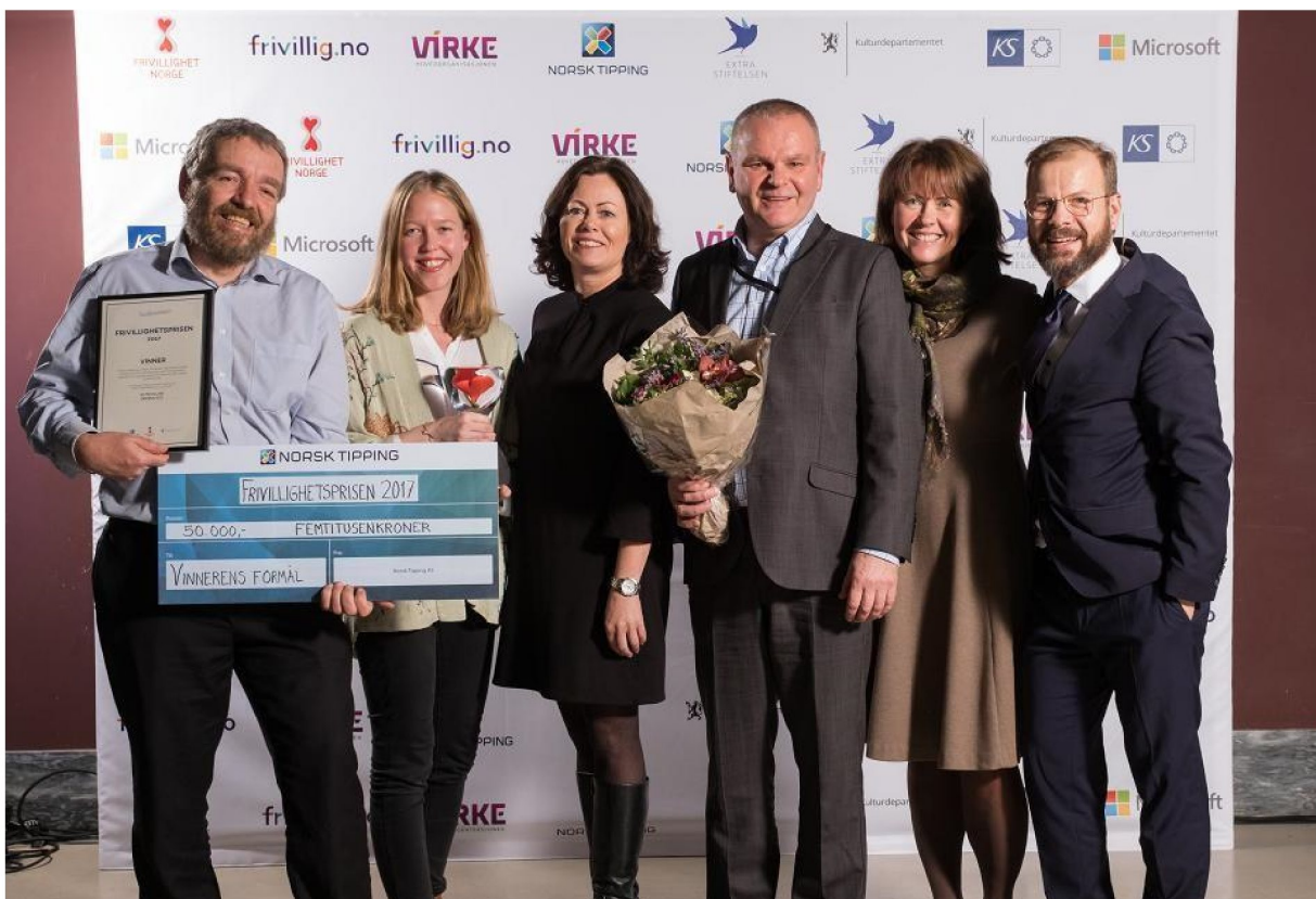
Kirkens SOS mottok Frivillighetsprisen 2017