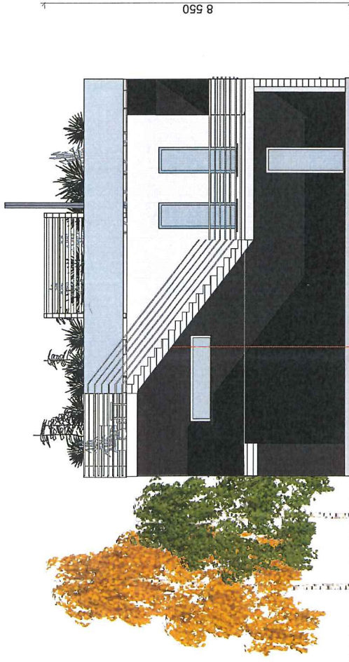
1:100 Fasade Ø