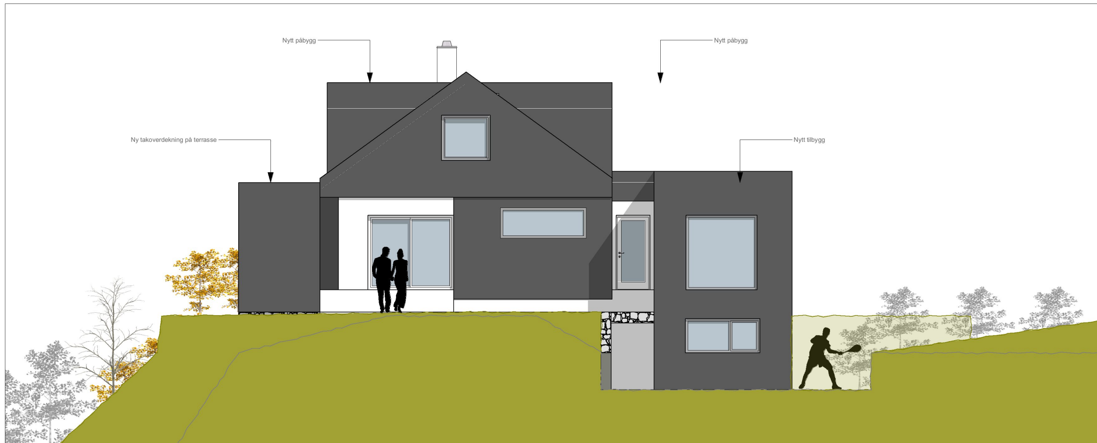
1:100 Fasade Øst

Tegningsnr.: A40-02 Revisjon nr.: 01 - UA