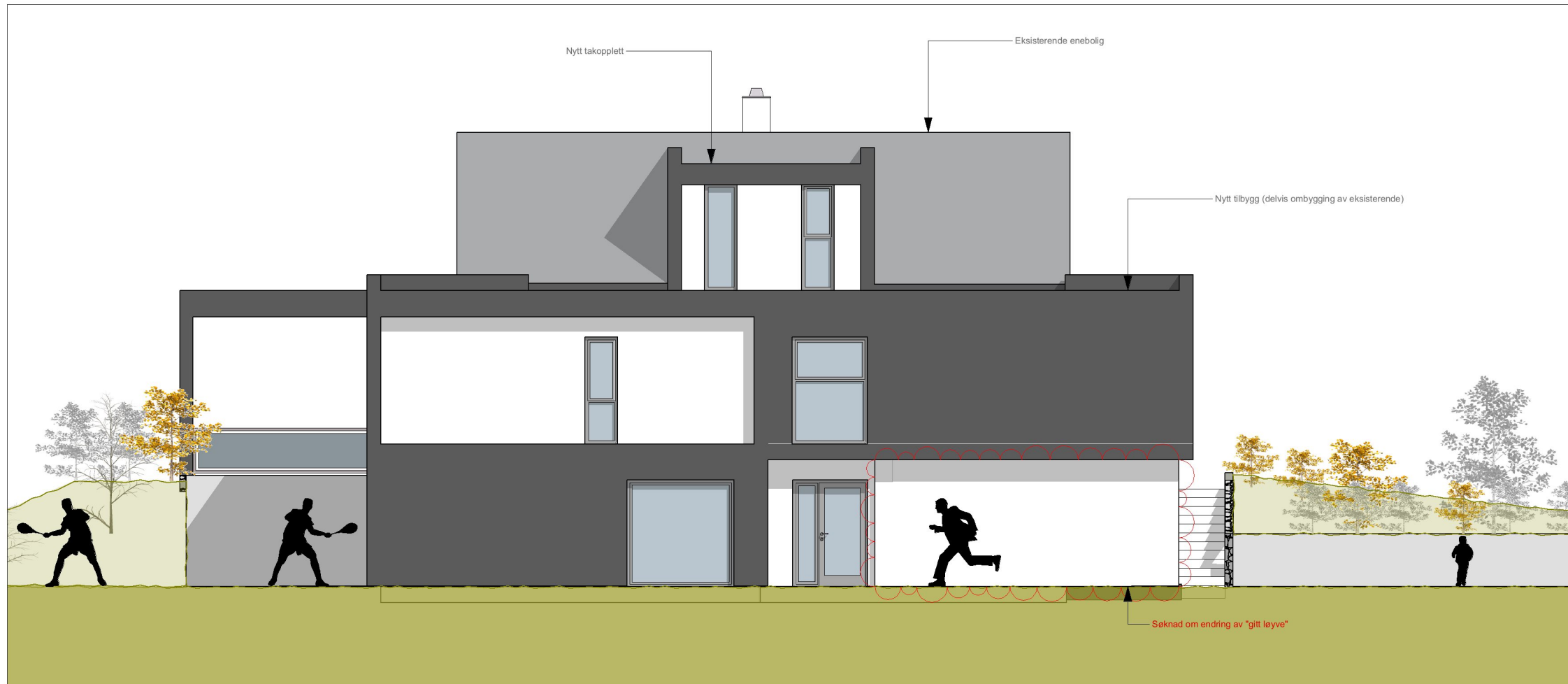
1:100 Fasade Nord