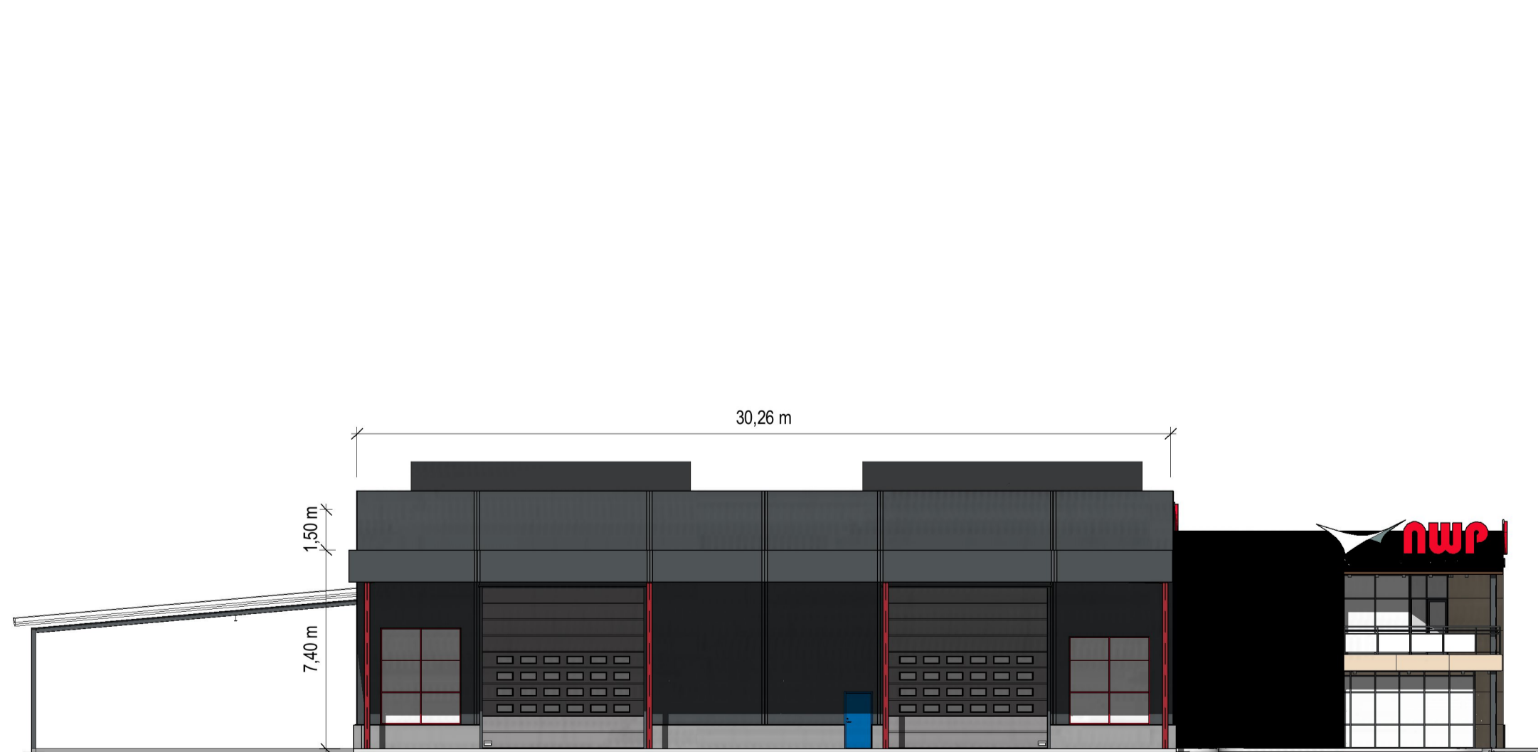
Sør/øst 1 : 200