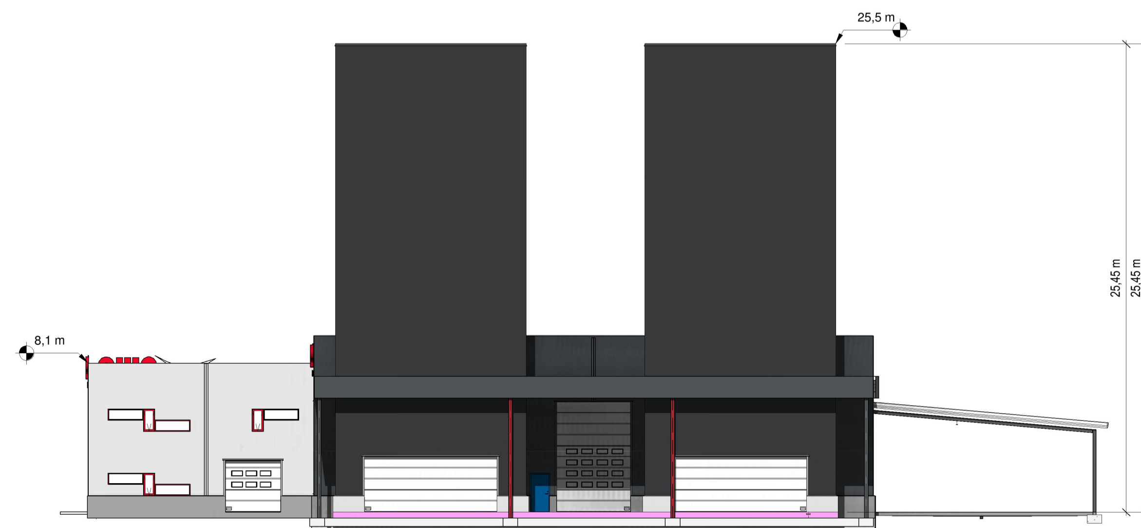
Nord/vest 1 : 200