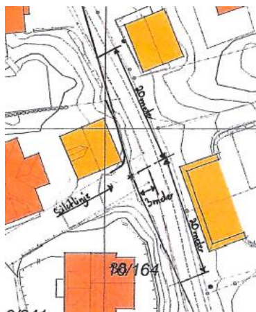
Utsnitt frå situasjonskart som viser siktlinen.

Frå før på eigedomen er det oppført ein garasje i tråd med byggelinen, men der fyllinga skråar ca. 2 meter ned mot kommunalvegen. Forstøtningsmuren skal dekke garasje fyllinga, og er prosjektert i to nivå. Muren heldt ein avstand på minimum 2 meter frå asfaltkant til kommunalveg, slik at m.a. areal til snø rydding og sikt blir ivaretatt. Avstanden til nabogrense i nord er 0 meter, og det ligg føre ein avstandserklæring. Muren blir 'trappa' i to nivå, med høgde på 1,5 meter, og 0,5 meter.