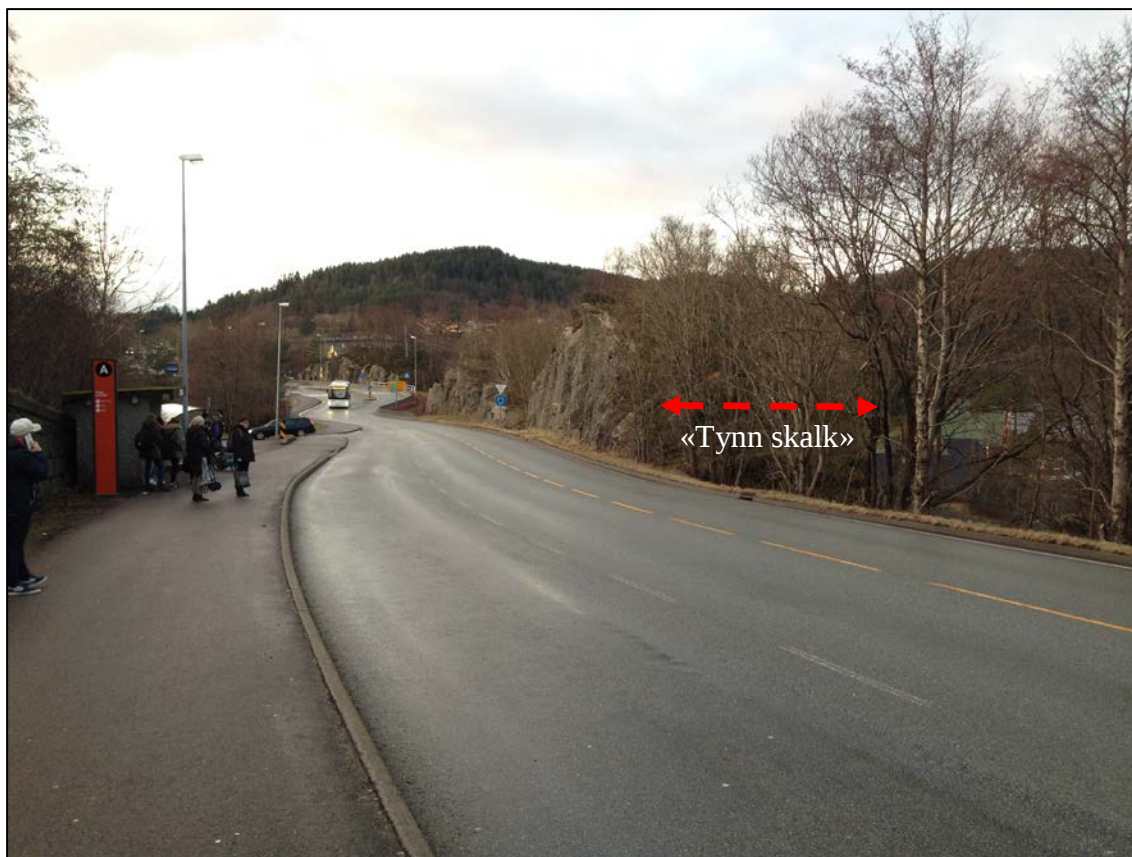
Figur 3. Oversikt over bergskjæringer langs Fv 564 Flatøyveien sett mot sør. Merk at det er bebyggelse i nedkant av bratte skjæringer mot fjorden.