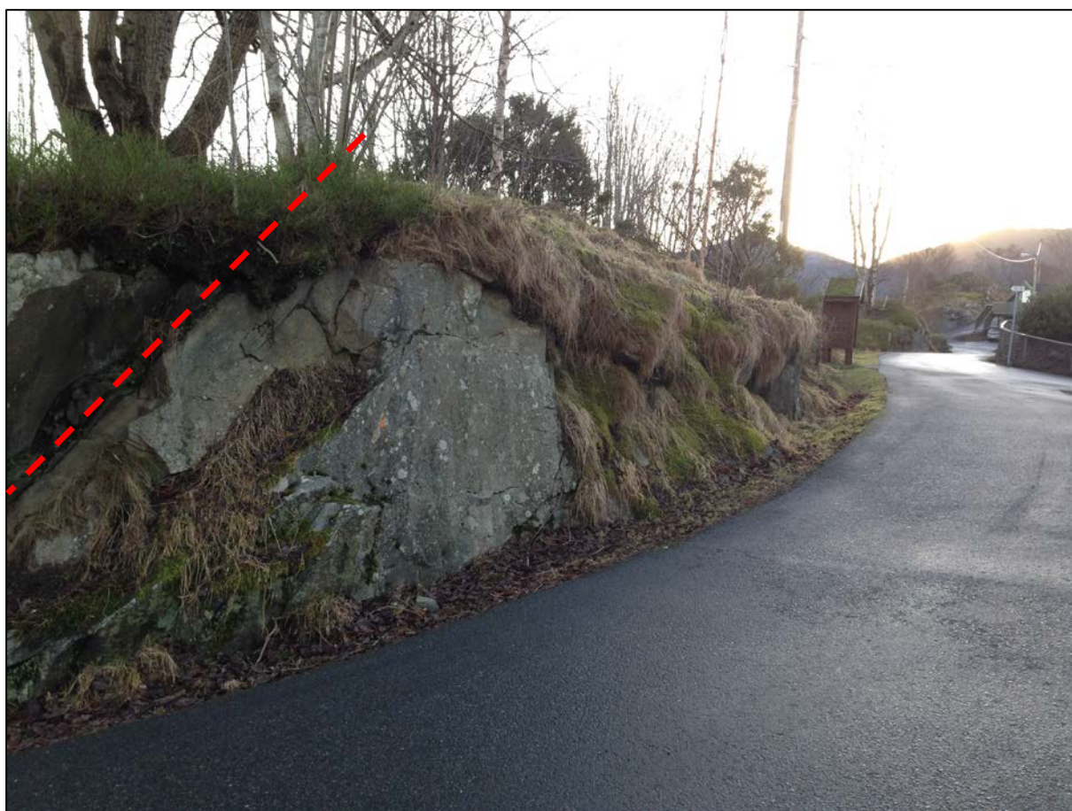
Figur 5. Berg i dagen langs dagens lokalveg i bakkant av ny innfartsparkering. Antatt foliasjonsplan er markert med rød siplert linje. Bergskjæring i bakkant av ny innfartsparkering bør sprenges ut langs foliasjonsplanet.

Når det foreligger et endelig forslag til utforming av bergskjæringer i bakkant av innfartsparkeringen, så kan geolog gi innspill til forslaget. Det må vurderes sikring av dagens lokalveg i forhold til valgt løsning for utsprengning av bergskjæringer i dette området.