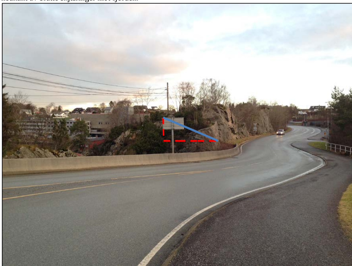
Figur 4. Oversikt over noen bergskjæringer langs Fv 564 Flatøyveien sett mot nord. Dersom skjæringene «legges», eller sprenges bort, så vil sikringsbehov og fremtidig vedlikehold reduseres mye. Blå linje skisserer skjæringsvinkel ca 1/3. Merk strømmlinje som vil bli påvirket av inngrep.