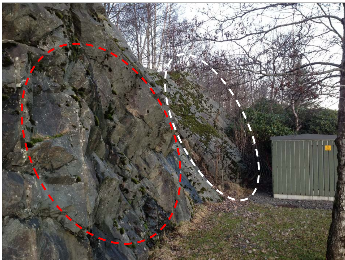
Figur 6. Utsprengt bergskjæring langs Ev 39 mot Nordhordalandsbrua. Nærmest fotografen er bergskjæringen sprengt ut med ca normalprofil 10/1. Dette fører til at bergflak blir stående uten fot, og det er behov for boltesikring (rød ellipse). Bak trafokiosken er foliasjonen ikke kuttet, og her er det lite sikringsbehov (hvit ellipse).

Det anbefales at en i videre planfaser planlegger med å sprengne langs foliasjonsplanet, fordi dette vil gi mer stabile bergskjæringer, og antatt mindre sikringsbehov.