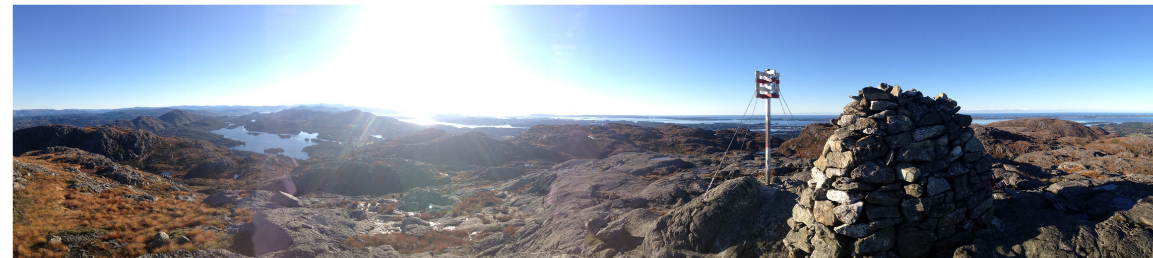
Utsikt frå Eldsfjellet med Storavatnet til venstre i biletet / the view from Eldsfjellet - the Storavatnet lake can be seen to the left.

Du må gjere rein kano og kajak før du set han på vatnet – hugs smittefaren! Dersom du vil fiske må du først ta kontakt med Midtre Holsnøy Grunneigarlag. Vis omsyn til lokaltrafikk når du kjem med bil og eventuelt hengar. Please clean your canoe thoroughly to avoid contamination of the waterway system! For fishing rights, please contact Midtre Holsnøy Grunneigarlag. Please show consideration to local traffic and parking regulations.