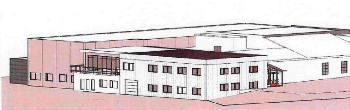
② 3D Sørøst

Administrasjonen viser til søknad med vedlegg journalført motteke 23.10.2018 i sin heilskap.