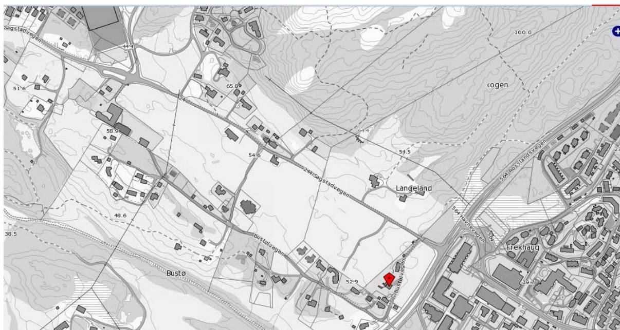
Figur 1 - 24/12 sine parseller med våningshus på hovedbruk merket rødt.

Det vises til forslag til kommuneplan for Meland Kommune lagt ut til høring av Formannskapet. Gård 24 bruk 12 har et innspill til denne høringen vedrørende en utskilt parsell bruket har ved Sagstad Skule. Dette er i sin tid en utskilt boligtomt tenkt benyttet i familien. Den har på grunn av naboskapet til Sagstad Skule ikke blitt godkjent for nevnte bebyggelse. Tomten fremgår av nedenforstående kart. Hovedbruket er ved senterområdet i kommunen, jmf kart under.