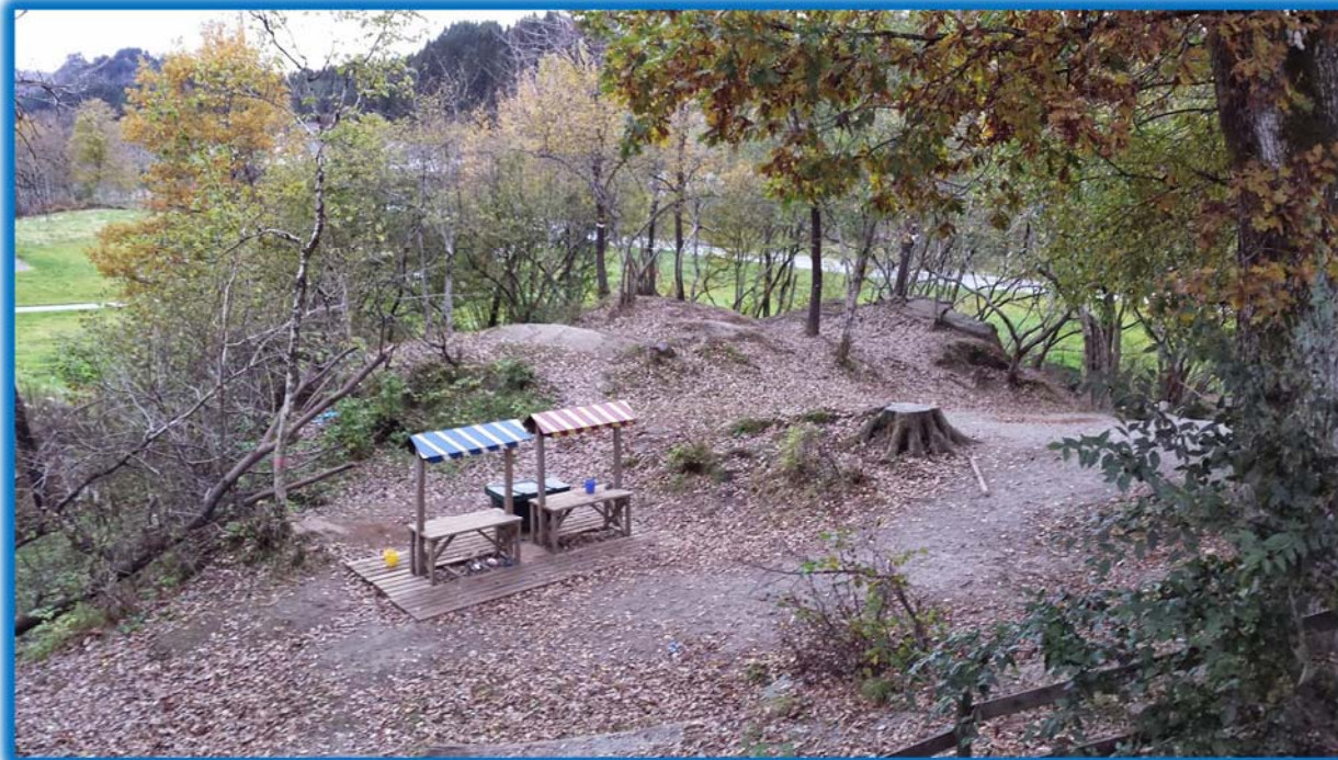
Figur 3 – bildet av parsellen og skulens bruk av området

Slik det fremstår av tidligere praksis og den plan kommunen legger opp til gjennom kommuneplanens arealdel videre, synes det som om nevnte utskilte boligparsell på ca 2 dekar ikke vil kunne bebygges eller nyttes til dette formål for grunneierne i overskuelig framtid.