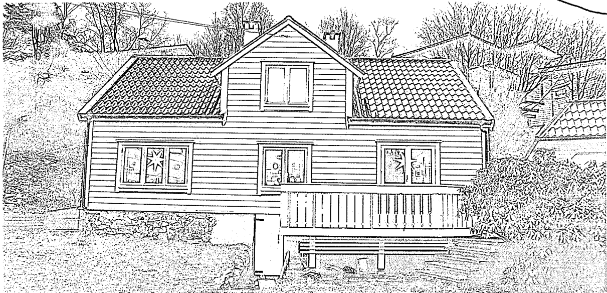
Nåv. fasade mot VEST