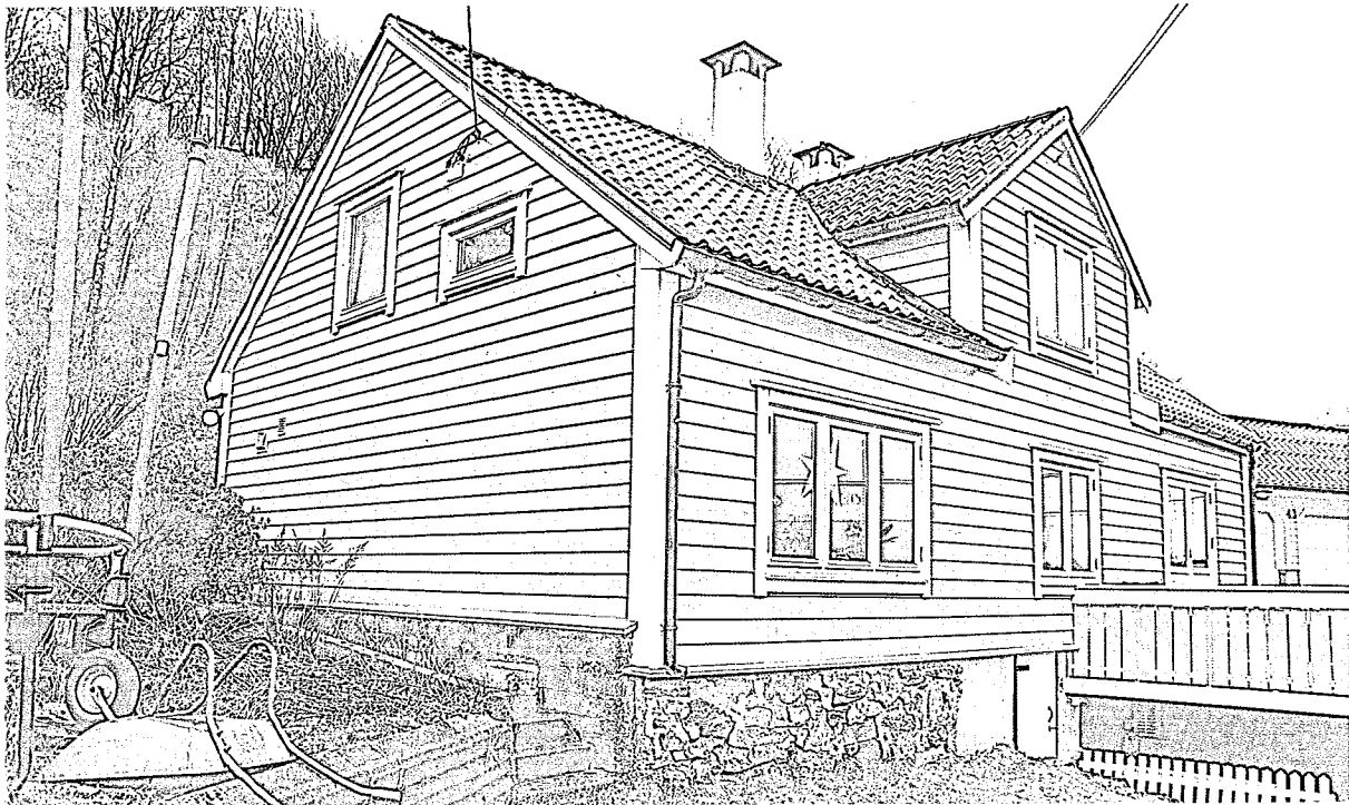
Nåv. gavlfasade mot NORD / Langsiden mot VEST

Gnr. 1 , bnr. 379 i Meland kommune Foto av nåv. Fasader, pr. 27.12.2018