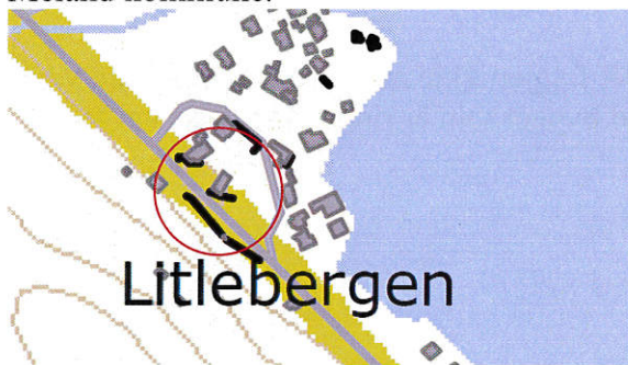
Utsnitt frå støyvarselkart.

Vegvesenet er også kritiske til om ein terrasse som vender ut mot vegen her vil vere eit eigna uteopphaldsareal, då dette er eit område utsett for vegtrafikkstøy, jamfør støyvarselkart 1 for Meland kommune.