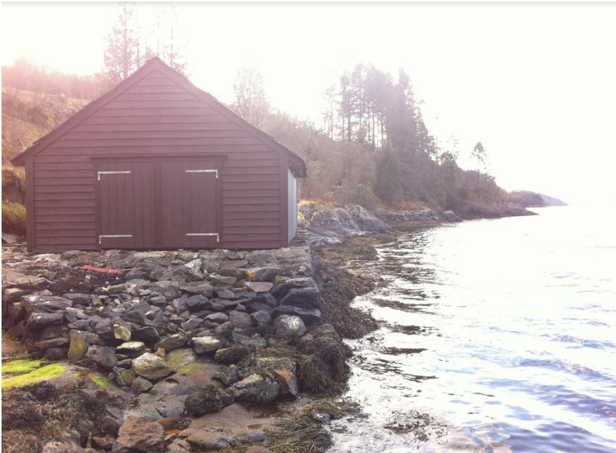
Foto: Eksisterande naust. Båttopprekk i forkant, kaifront til høgre. Biletet er tatt på fjære sjø. Svaberg til høgre for eksisterande kai gjer at ein ikkje kun kan nytte kaien ved flo sjø.

Kart over: Plassering og storleik på tiltak