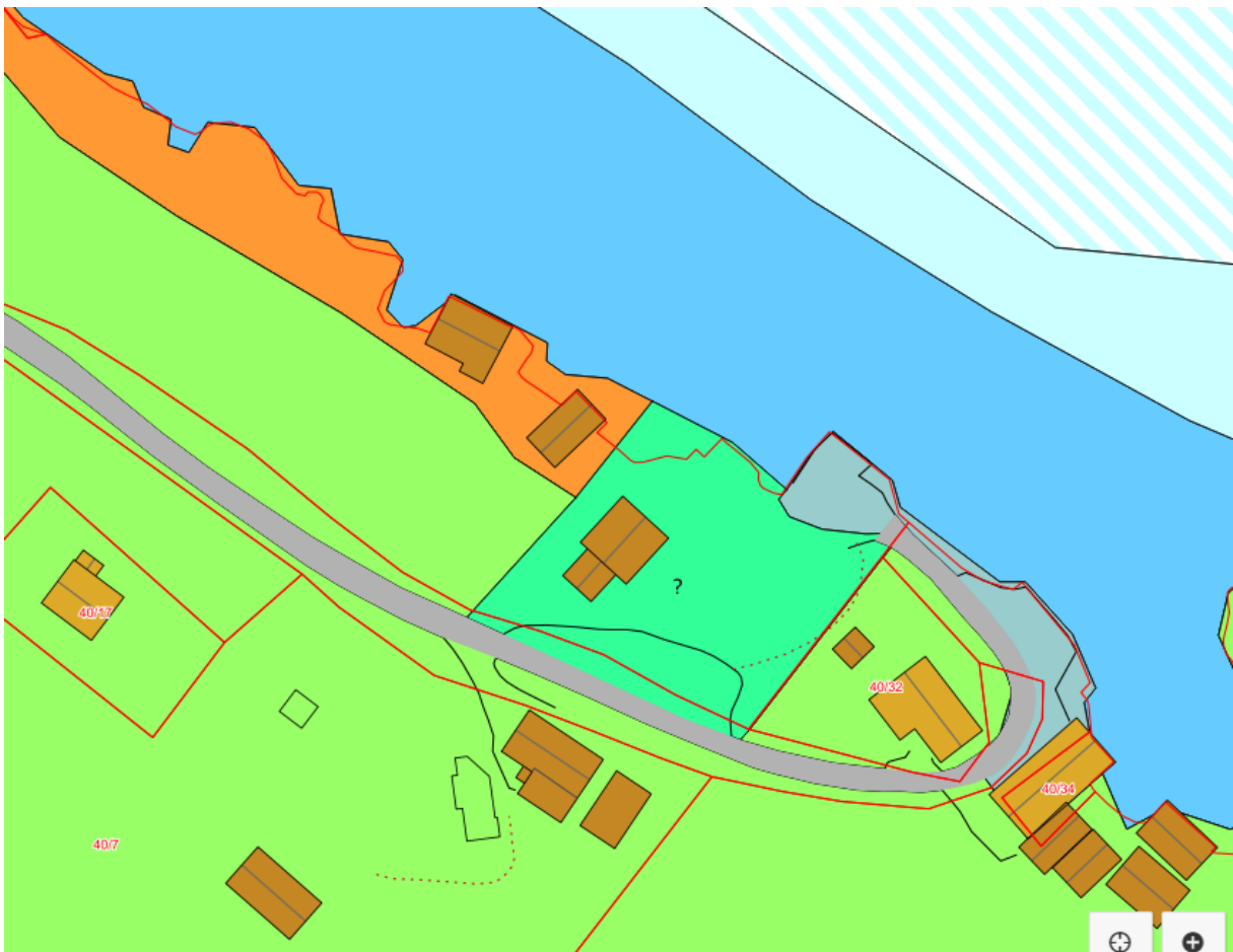
Skjermdump frå gjeldande kommuneplan. Tiltaket gjeld naust lengst nordvest på kartet

Tiltaket gjeld utviding av eksisterande kai om lag mellom 1,3 og 2 meter nordvestover mot eksisterande grunne/svaberg, og vil såleis ikkje påverke tryggleik eller framkomme i kommunens sjøområde. Sjøområdet rundt naustet er i gjeldande kommuneplan markert som småbåthavn, og den er vist som hamn i sjøkart.